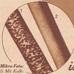
Mikro-Foto: 1) Mit Kalkseife bedecktes, rauhes Haar (grauer Belag). 2) Mit Extra-Mild gewaschenes Haar: blank und glänzend.