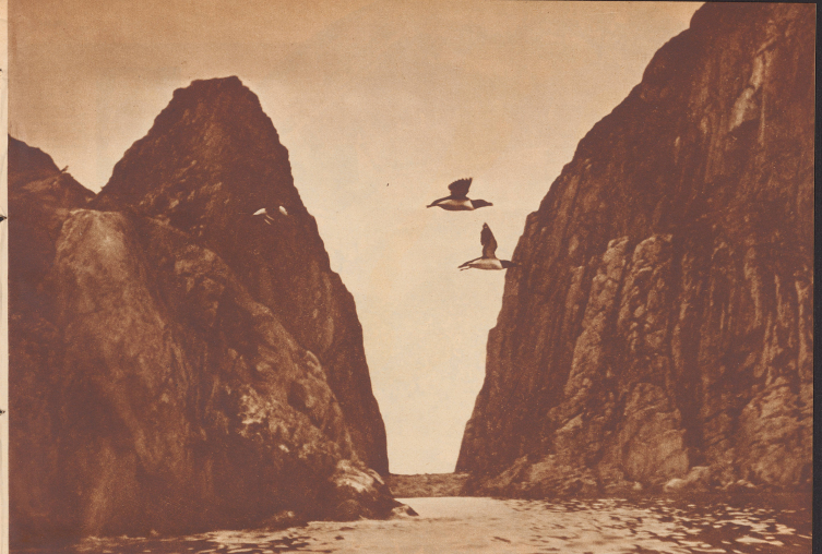
Fliegende Tordalkpaare zwischen den steilen Wänden der Vogelberge. Zufolge seiner verstimmelten Flügel liegt der Alk nur sehr ungeschickt auf dem Lande bewege er sich mit kurzen, wackelnden Schritten schiefwärtig vorwärts. Dagegen ist er aber ein meisterhafter Schwimmer und Taucher.