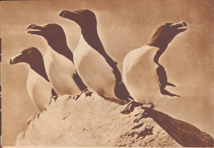
Zwei befremdete Tordalkpaare auf der höchsten Spitze des Vogelberges Syd-Fuglöy. Der Tordalk gehört zur Familie der Schwimmvögel. Er wird 45 cm groß, besitzt einen wasserfesten Leib und kurze, wie haken eingelenkte Beine mit dreifelligen Schwimmhäuten. Brust und Bauch sind weiß, Kopf, Hals und die Oberseite schwarz gefärbt.