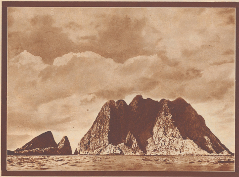
Syd-Fuglöy, das Tordalken-Reservat in den nördlichen Lofoten. Wie ein Märchenhügel aus alter Zeit steht die Insel auf dem ewig unruhigen Fluten des Eismers in dem grossen Himmel.