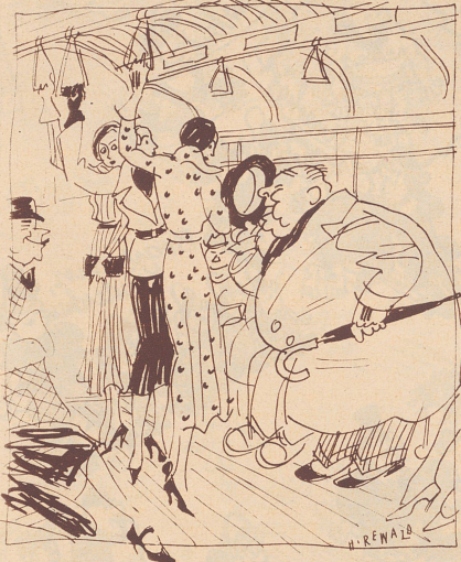
«Darf ich den Damen meinen Platz anbieten!?»

«Ich kann ohne Ihre Tochter nicht leben!» ruft pathetisch der Freier aus. «Junger Mann, auf ein anständiges Begräbnis soll es mir nicht ankommen», meint voller Gemüt der Schwiegervater in spe.