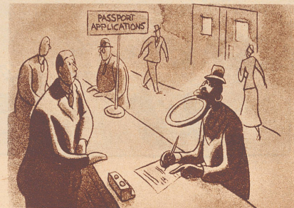
Auf dem Paßbüro.

«Ihr Hausknecht scheint wirklich ein fleißiger Arbeiter zu sein.» «Ja. Das ist seine Spezialität.» — «Das Arbeiten?» — «Nein, das Scheinen.»