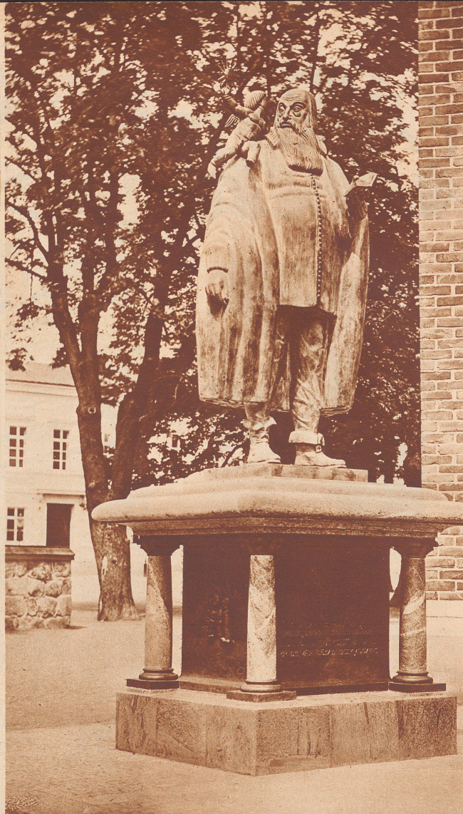
Rudbeckiusdenkmal in Vasteras.