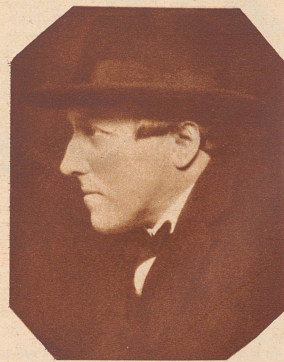
Neueste Aufnahme von Bildhauer Carl Milles