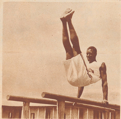
Übung am Barren. Das Gerät ist ziemlich primitiv, die Übung selbst auch nicht ganz einwandfrei.