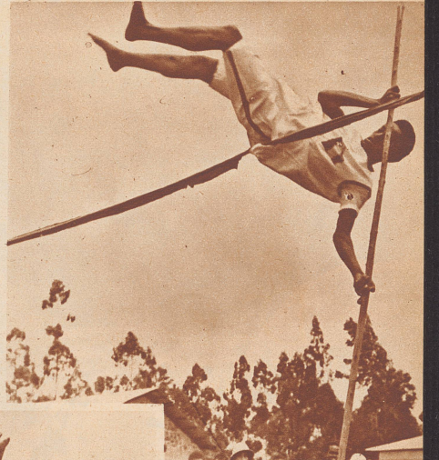
Unter den abessinischen Leichtathleten gibt es bereits einige ganz ausgezeichnete Stabhochspringer. Der Abessinier ist sehr elastisch. In dieser Disziplin sind von ihm Höchstleistungen zu erwarten.