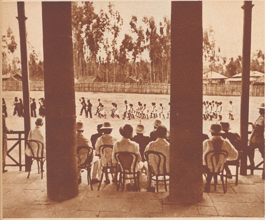
Vorbeimarsch der Sportler an der Ehrentribüne, wo die Gäste Platz genommen haben.

Das sind ein paar Bilder von dem ersten großen Sportfest in Abessinien, das vor kurzer Zeit in Addis Abeba stattfand. Einige hundert Schüler aus den verschiedenen Lehranstalten der Hauptstadt trafen zu einem Meeting zusammen, um ihr sportliches Können zu zeigen. In der Tat waren da ganz respektable Leistungen zu sehen. Sportübungen in jeder Form werden in Abessinien erst seit einem Jahr offiziell gepflegt. Die hervorragenden Leistungen haben einerseits gezeigt, daß die Abessinier eine Sportnation ersten Ranges werden können, andererseits war diese eindrucksvolle Demonstration ein Beweis für den Reformwillen und die modernen Lebensanschauungen des gegenwärtigen Kaisers.