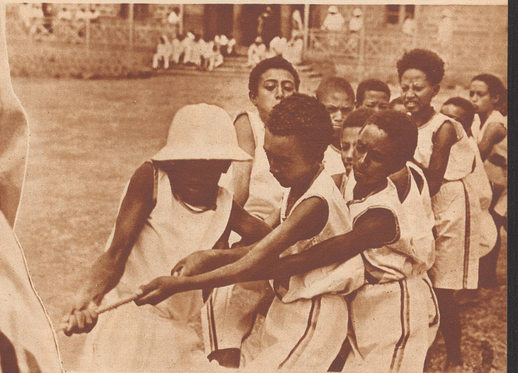
Das Tauziehen gehörte mit als unterhaltsame Nummer ins Programm des Meetings. Den jungen Sportlern mit den eigenartigen Haarfrisuren scheint die Übung viel Spaß zu machen.