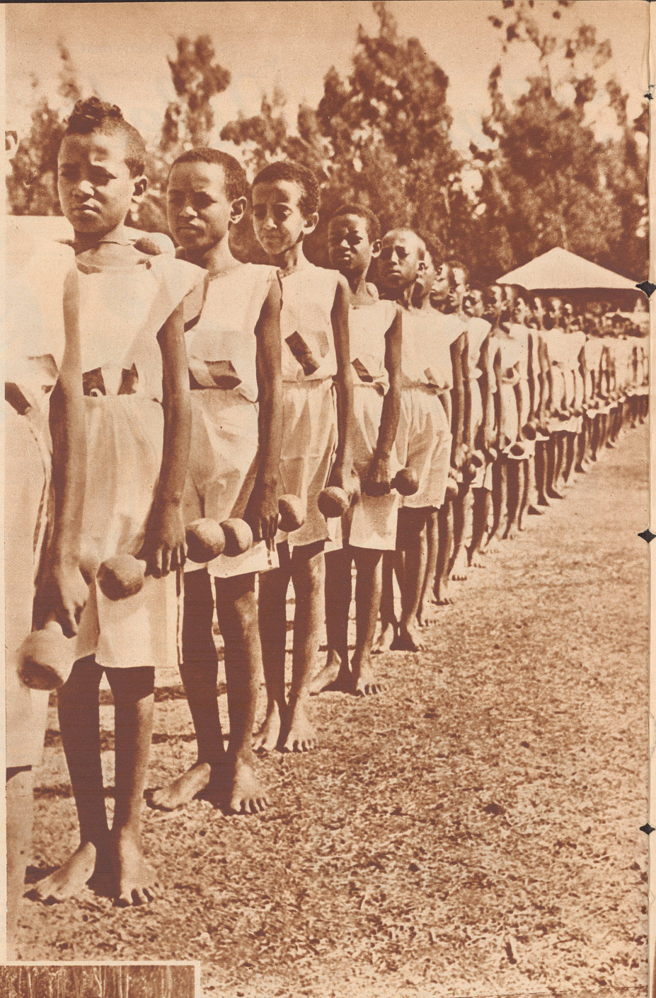
Die jungen Sportler sind zu einer Hantelübung angetreten.

Das sind ein paar Bilder von dem ersten großen Sportfest in Abessinien, das vor kurzer Zeit in Addis Abeba stattfand. Einige hundert Schüler aus den verschiedenen Lehranstalten der Hauptstadt trafen zu einem Meeting zusammen, um ihr sportliches Können zu zeigen. In der Tat waren da ganz respektable Leistungen zu sehen. Sportübungen in jeder Form werden in Abessinien erst seit einem Jahr offiziell gepflegt. Die hervorragenden Leistungen haben einerseits gezeigt, daß die Abessinier eine Sportnation ersten Ranges werden können, andererseits war diese eindrucksvolle Demonstration ein Beweis für den Reformwillen und die modernen Lebensanschauungen des gegenwärtigen Kaisers.