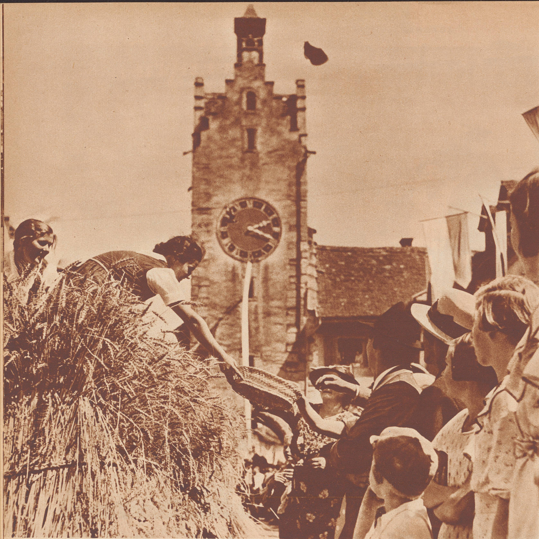
Am Thurgauischen Trachtenfest in Dießenhofen hat ein köstlicher, farbiger Festzug mit Darstellungen vom Segen und von den Genüssen des Landlebens das ganze Städtchen voll Zuschauer begeistert und erfreut. — Bild: Ein Brotwagen mit vielen Zwei- und Vierfüßlern, mit einem Teigtrog und mit Mehlsäcken beschenkt mit seinen Gaben bevorzugte Gäste am Wege.