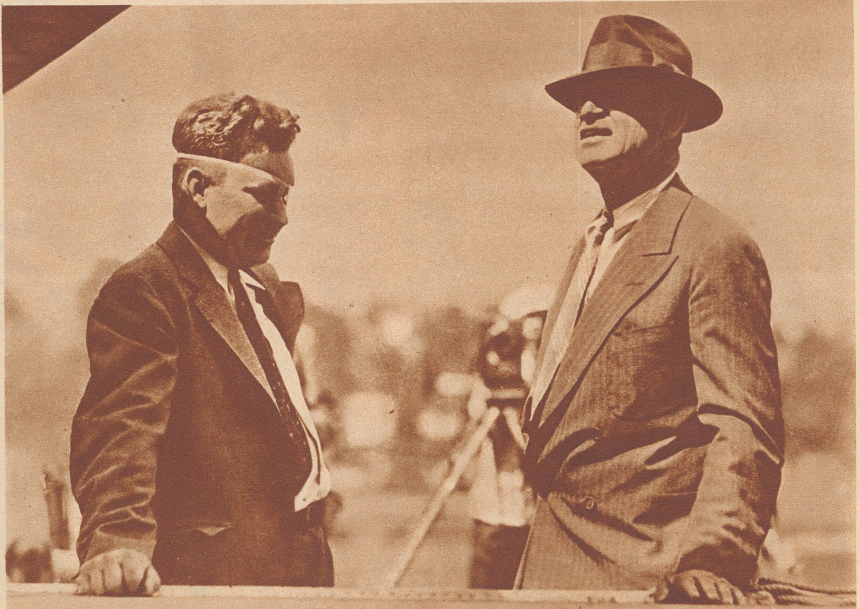
Der einäugige Flieger Wiley Post (links) und sein Freund, der berühmte Schauspieler und Humorist Will Rogers, kurz vor dem Aufstieg.