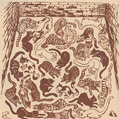
Die Maus sollte den Weg ins Mäuseloch finden, ohne ins Blickfeld einer Katze zu geraten.

Cowboy als humoristischen Erzähler für sein Theater. Will Rogers hatte ungeheuren Erfolg und war bald einer der beliebtesten Humoristen Amerikas. Nicht allein auf den Bühnen trat er auf, sondern man bat ihn auch in die Zeitungen zu schreiben, weil das, was er sagte, nicht nur lustig war, sondern auch einen Sinn hatte. Die Laufbahn dieser beiden Männer ist wirklich phantastisch — ganz amerikanisch kann man sagen. Die Beiden sind eigentlich der beste Beweis dafür, daß man mit festem Willen un-