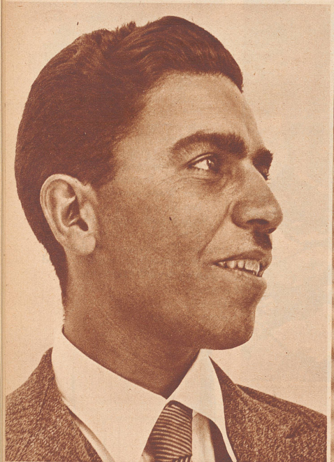
Das ist ein Emporkömmling aus dem persischen Stadtproletariat. Sein Vater war noch Hamal, Lastarbeiter letzter Sorte, seine Mutter hatte schwarzes Sklavenblut in den Adern. Er selbst hat sich als Kind noch halbnackt in den Straßen von Teheran herumgetrieben. Aber das Leben in der Großstadt bietet Gelegenheit höher zu kommen. Er erfaßte die Gelegenheit und ist Herrschaftskoch geworden. Für persische Verhältnisse eine ziemlich gehobene und gutbezahlte Stellung.