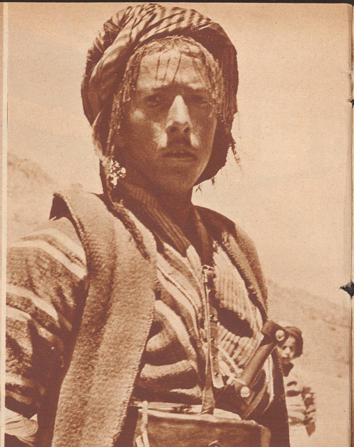
Junger Kurde. Den Iranern stammverwandt sind die Kurden. Ihre Sprache ähnelt sehr der persischen, nur daß sie sich nicht einer so alten und reichen Kultur und Literatur rühmen können, wie ihre persischen Vetter. Ihre Heimat ist Kurdistan, jener berühmte Wetterwinkel Vorderasiens, wo die Türkei, Mesopotamien, Persien und das transkaukasische Rußland aneinanderstoßen.