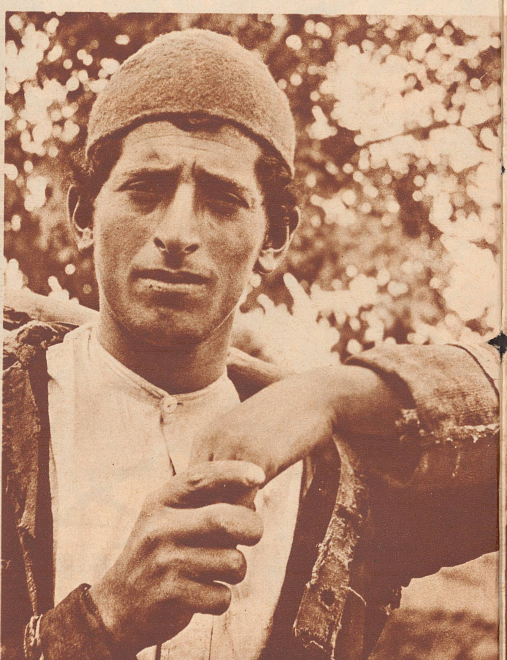
Das ist ein seltener Fall von Vermengung von iranischem mit arabisch-semitischem Blute. Diese Blutmischung gibt Energie und Durchschlagskraft. Der Mann, kaum 20 Jahre alt, ist schon Vorarbeiter beim Straßenbau, und dank seiner arabisch verwurzelten Schlaueit macht er nebenher kleine Geschäfte auf eigene Rechnung mit Werkzeugen, Draht und Nägeln.