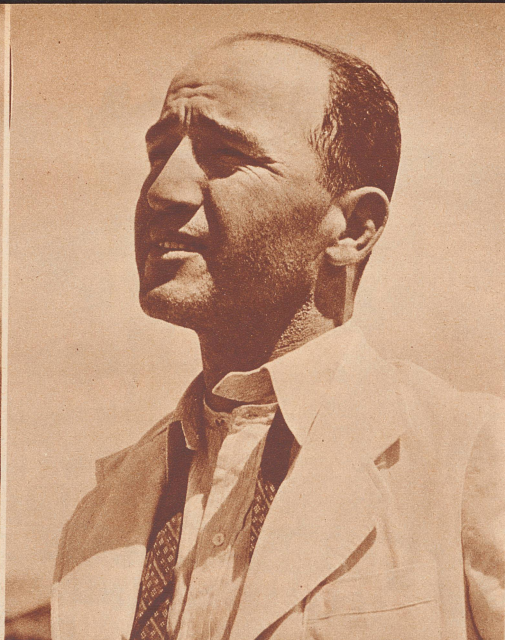
Ein Mann des modernen Persien. Rassenbewußter und rassenstolzer Iranier. Er hat in Europa studiert und leitet jetzt, trotz seiner kaum 30 Jahre, als Chefingenieur den Bau einer Hochgebirgsstraße von 600 km Länge.