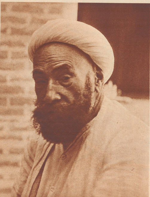
Dieser Mann ist das Oberhaupt eines führenden Derwischordens. Aus altem iranischem Geschlecht stammend, ist er kraft seiner hohen geistlichen Würde von unbegrenzter Ehrfurcht des Volkes umgeben. Er ist reich gebildet, nicht nur auf religiösem Gebiet, sondern auch in Philosophie und Geschichte. Bei allem Festhalten am alten Glauben und Volkstum kennt und schätzt er doch die Errungenschaften westlicher Zivilisation. Er lehnt die Einflüsse der neuen Zeit nicht ab, sondern sucht sie zum Besten des Volkes auszunutzen.