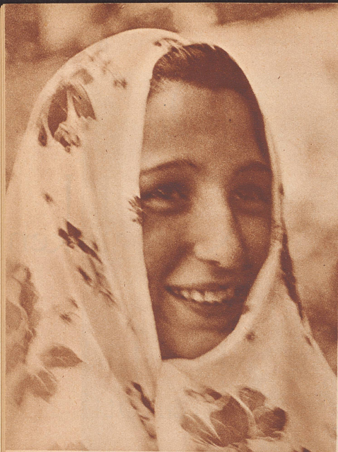
Junge Perserin, die Gattin eines wohlhabenden Kaufmanns. Sie trägt noch die alte Nationaltracht, den sogenannten Schador, der Kopf und Gestalt ganz einhüllt. Dieses eigenartige Kleidungsstück ist hell und geblümt für den Hausgebrauch, dunkel für die Straße.