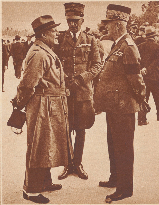
Bildbericht von H. F. S. Man

Wird Italien trotz Völkerbund und Kelloggpaakt Abessinien annekieren oder sich zum mindesten ein Protektorat über das ostafrikanische Kaiserreich sichern? Diese Frage steht heute im Mittelpunkt aller politischen Geschehens. Neben der westafrikanischen Negerrepublik Liberia ist Abessinien das letzte Land in Afrika, das noch nicht unter europäischer Oberhoheit steht. Der Herrscher von Abessinien hofft, daß sich «schlimmstenfalls» das Disaster von Adua des Jahres 1896 wiederholen werde. Wenn die Regenzeit Ende September vorbei ist, wird es sich zeigen, ob er sich nicht getäuscht hat. Das Vorgehen Mussolinis gegen Abessinien ist für ihn bereits zwangsläufig geworden, um die bisherige Kolonialpolitik und Kolonisierungspläne Italiens zur Durchführung zu bringen. Der nachstehende Bericht über Italiens jüngste Kolonie «Tripolitanien» zeigt, was der Duce gewollt hat, was er bisher erreicht hat und daß der gesamte Kolonialbesitz Italiens ungeeignet für die Durchführung dieser großen Kolonialpläne ist.