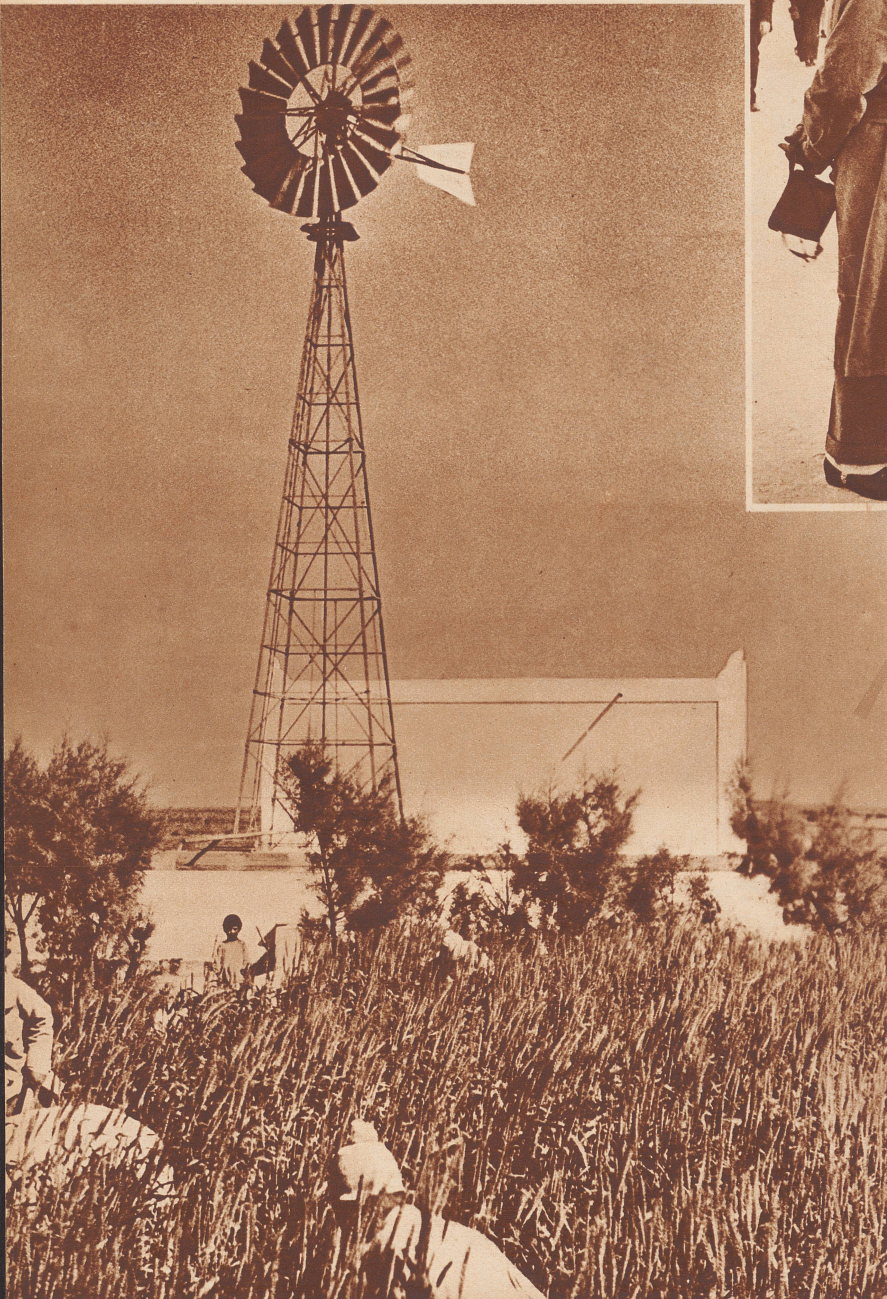
Ein Weizenfeld in der Wüste. Vor wenigen Jahren waren hier noch Sanddünen; soweit das Auge reicht nichts als gelber, heißer Sand. Der Weizen ist jetzt etwa 1,30 Meter hoch, drei Monate alt, aber noch nicht ganz ausgewachsen. Die Ernte erfolgt Ende des vierten Monats nach der Aussaat. Zum Schutze gegen den trockenen Flugsand mit sich führenden Wüstenwind sind die Felder mit Tamarix-Sträuchern umsäumt. Im Hintergrund die Quelle des Lebens — der erbohrte Brunnen. Die Windmühle befördert das kostbare Wasser aus vielen Metern Tiefe in die davor liegende Zisterne. Von hier aus erfolgt durch Kanäle die Verteilung in die Felder.

Drei für die koloniale Erschließung, Entwicklung und Verwaltung Italiens in Afrika bedeutsame Männer: Von links nach rechts: Conte Volpi di Misurata, langjähriger Gouverneur von Tripolis und der Cyrenaica, General Graziani, der gegenwärtige Oberkommandant der italienischen Truppen in Ostafrika und der aus dem Weltkrieg bekannte Marschall Badoglio, der ebenfalls ein paar Jahre Gouverneur der nordafrikanischen Besitzungen war. Außer diesen drei Männern haben sich auch General de Bono und in jüngster Zeit General Balbo administrativ erfolgreich in Afrika betätigt.