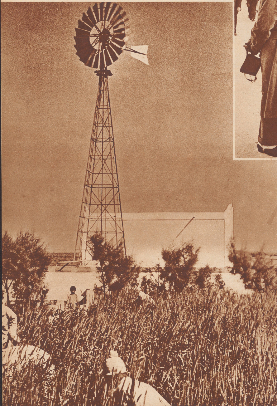
Ein Weizenfeld in der Wüste. Vor wenigen Jahren waren hier noch Sanddünen; soweit das Auge reicht nichts als gelber, heißer Sand. Der Weizen ist jetzt etwa 1,30 Meter hoch, drei Monate alt, aber noch nicht ganz ausgewachsen. Die Ernte erfolgt Ende des vierten Monats nach der Aussaat. Zum Schutze gegen den trockenen Flugsand mit sich führenden Wüstenwind sind die Felder mit Tamarix-Sträuchern umsäumt. Im Hintergrund die Quelle alles Lebens — der erbohrte Brunnen. Die Windmühle befördert das kostbare Wasser aus vielen Metern Tiefe in die davor liegende Zisterne. Von hier aus erfolgt durch Kanäle die Verteilung in die Felder.

Drei für die koloniale Erschließung, Entwicklung und Verwaltung Italiens in Afrika bedeutsame Männer: Von links nach rechts: Conte Volpi di Misurata, langjähriger Gouverneur von Tripolis und der Cyrenaica, General Graziani, der gegenwärtige Oberkommandant der italienischen Truppen in Ostafrika und der aus dem Weltkrieg bekannte Marschall Badoglio, der ebenfalls ein paar Jahre Gouverneur der nordafrikanischen Besitzungen war. Außer diesen drei Männern haben sich auch General de Bono und in jüngster Zeit General Balbo administrativ erfolgreich in Afrika betätigt.