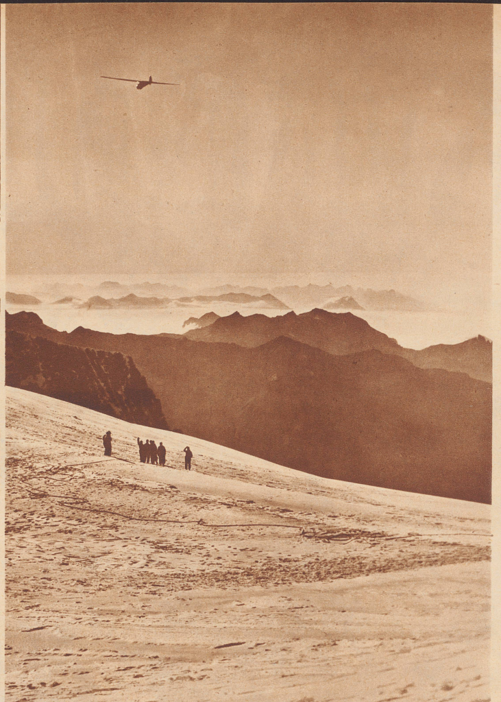
Ein Bild von majestätischer Großartigkeit. Der Segler ist vor drei Minuten mit dem Gummiseil gestartet worden. Jetzt plant er hoch über den Gipfeln und dem Nebelmeer, um eine Stunde später in Thun zu landen.