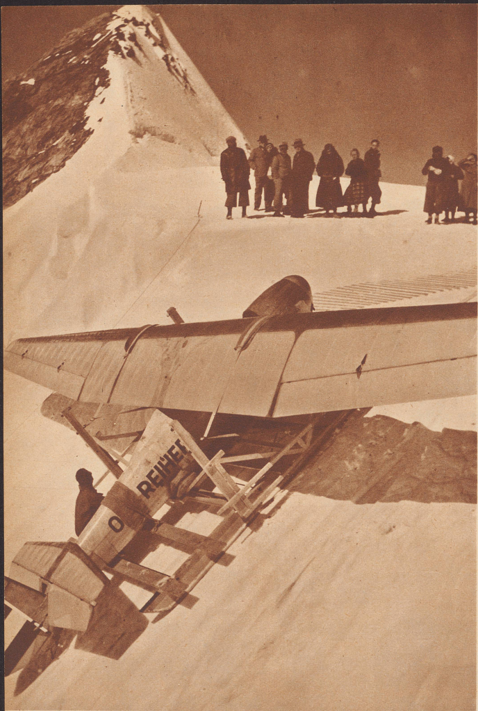
Schwieriger Transport eines Segelflugzeuges von der Station Jungfrauoch über den Firn auf das 50 Meter höher gelegene Plateau.