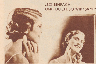
„SO EINFACH — UND DOCH SO WIRKSAM!“

Ich weiß, warum berühmte Schönheitspezialisten Palmolive empfehlen. Dank ihrer Zusammensetzung aus Oliven- und Palmölen, befreit ihr tief eindringender Schaum die Poren von allen Unreinheiten. Keine Mitesser und Pickel mehr. Mit Palmolive erhalte ich meine Haut gesund, straff — zart gefolgt.