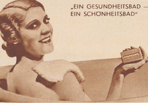
„EIN GESUNDHEITSBAD — EIN SCHÖNHEITSBAD“

Als vorsichtige Mutter habe ich von Anfang an auf richtige Hautpflege bei meinen Kindern geachtet. Ich wollte ihnen die natürliche Reinheit ihrer Haut erhalten. Mein Arzt riet mir, Palmolive zu benützen: „Ihr reicher Olivenölschaum ist ideal, um empfindliche Haut zu reinigen und zu schützen.“