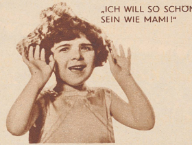
„ICH WILL SO SCHÖN SEIN WIE MAMMI!“

Ich weiß, warum berühmte Schönheitspezialisten Palmolive empfehlen. Dank ihrer Zusammensetzung aus Oliven- und Palmölen, befreit ihr tief eindringender Schaum die Poren von allen Unreinheiten. Keine Mitesser und Pickel mehr. Mit Palmolive erhalte ich meine Haut gesund, straff — zart gefolgt.