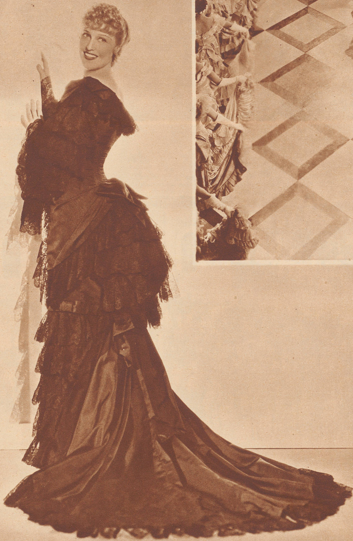
Jeanette Macdonald in der Titelrolle.