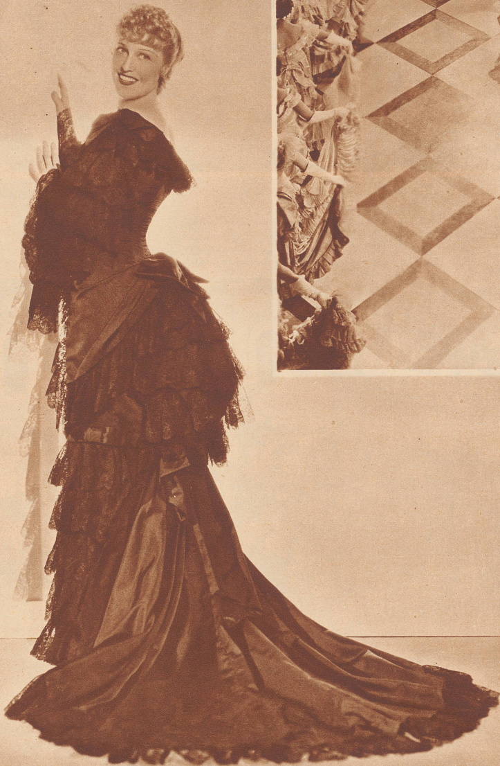
Jeanette Macdonald in der Titelrolle.