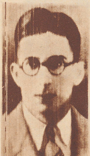
Der Attentäter: Dr. Karl Weiss. Er wurde nach der Tat von der Leibwache Longs niedergeschossen.

Damit schuf er sich eine große Zahl erbitterter Feinde. Dennoch war seine Anhängerschaft sehr zahlreich, und viele sahen in ihm den nächsten Präsidenten von U. S. A. Jetzt ist er von einem jungen Arzt in den Wandelgängen des Parlamentes in Baton-Rouge mit zwei Revolverschüssen ermordet worden. Seine Beerdigung in Baton-Rouge, der Hauptstadt des Staates Louisiana, gestaltete sich zu einer Riesenmanifestation. Mehr als 50 000 Menschen nahmen daran teil.