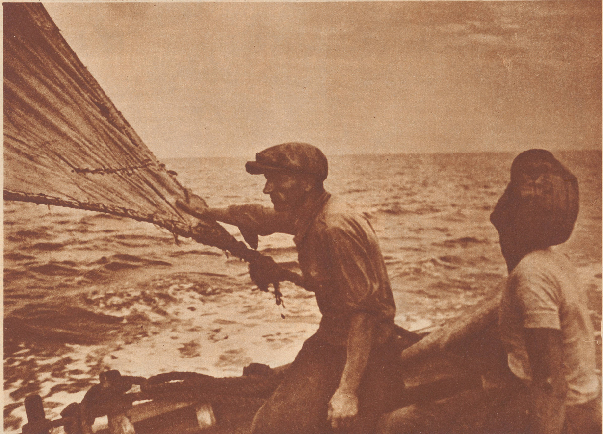
Italienische Fischer auf dem Ligurischen Meer.