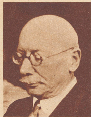
† Frank L. Füllol Vertreter der Schweize- rischen Depeschagen- tur beim Völkerbund in Genf und prominentes Mitglied des Vereins der Schweizerpresse, starb 69 Jahre alt in Genf.