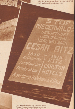
Der Honorarverein des Kantons Wallis hat am Empfang des Dorfes Niederwald an einem Hauptabend diese Tafel übergeben lassen. Sie ist das einzige «Flaker» in der Gemeinde, aber die paar niederwalliser deutschen, französischen und englischen Worte werden einen Stuhl der großen und kleinen Welt in das stille Dorf bringen und lassen die Vorbildern über einen Augenblick lang nachdenken über die Geschichte eines Erfolgsglücks.