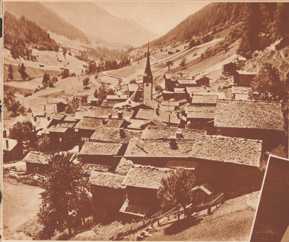
Niederwald im Oberwallis. Hier wurde Cesar Ritz als dreizehnter Kind der Familie geboren. Auf dem Friedhof ruhen seine Eltern und Großvater. Cesar Ritz selbst liegt in Luzern begraben. Das Dorf ist noch frei von Blödhörnern und Felsstürzen, und der «Heimatschutz» hat hier noch nichts zuzusetzen.