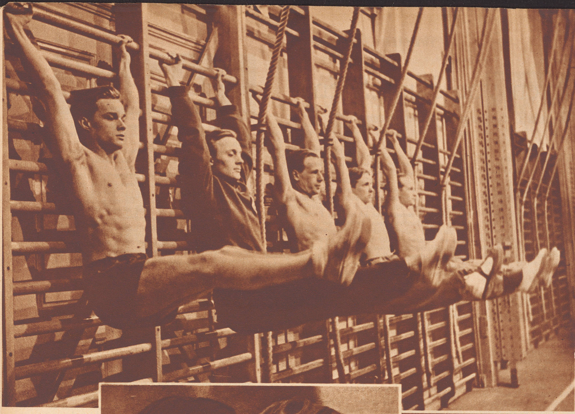
Hängebeugung an der Leiter zur Stärkung der Bauchmuskeln. Die Stellung ist außerordentlich schwer und anstrengend. Sie gelingt einwandfrei erst nach längerer Übung.