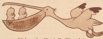
«Nicht wahr, Mami, Zwillinge bringt doch der Pelikan?!»

Der Stift. Der Chef überraschte den Stift, als er eine kleine, junge Stenotypistin küßt. «Sie sind hier nicht als Lippenstift engagiert!» donnert ihn der Chef an.