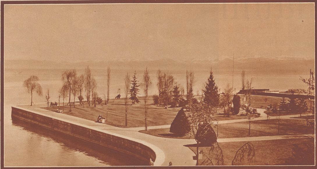
Seeпарк in Romanshorn.