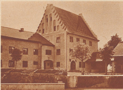
Das Schloß in Bischofszell stammt aus dem Anfang des 15. Jahrhunderts und ist 1932 renoviert worden.

Zwischen trüben und regnerischen Werktagen tat sich ein heller Sonntag auf. Er schien uns wie geschaffen für einen tüchtigen Ueberlandlauf. Vom sommerheißen Bodensestrand wanderten wir kreuz und quer über die Felder, durchs Unterholz in die Wälder. Ein rotbrauner Rehbock mit runden, glänzenden Augen sprang uns fast vor die Füße, worauf wir beidseits schweigend verharren, bis er durch einen Sprung den Weg ins Dickicht fand. Als wir aus dem Waldesdunkel traten, grüßte ein Dorf mit einem großen Schloß in der Tiefe. Es war das Dorf Hagenwil. Sein Schloß, das in einem Weiher steht, betritt man über eine alte, gutehaltene Zugbrücke, der einzigen noch bestehenden in der Ostschweiz. Der vom Hauptgebäude umschlossene Turm des Schlosses wurde von Rudolf von Hagenwil ums Jahr 1220 aus Findlingen erbaut. Es gibt nur wenige solcher sturmesteter Findlings-Türme in der Schweiz. Bei Mammertshofen im Schloß, nicht weit von Hagenwil, steht ein noch gewaltigerer Turm aus Findlingen, die in den unteren Lagen oft mehr als 1,30 m im Durchmesser haben. Menschen türmten bei der Fronarbeit solche riesigen Naturblöcke, die der Rheingletscher im Grenzgebiet hatte liegen lassen, mit unendlicher Mühe zu Turmhöhe, um in Kriegs- und Notzeit darin Schutz und Zuflucht zu haben. Solche Türme bezwang nur der Hunger, der die verzweifelnden Belagerten in die Knie zwang und fällte.