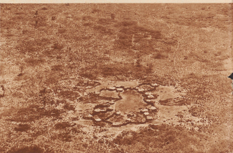
Viehstückerzählung am Schäfer in der Provinz Arusi. Die Arusier wachen in Sippenverbänden zusammen. Zu Beginn der Regenzeit werden die Ställe verlassen. Mit ihrem Viehherden ziehen die Arusier auf die Wanderung zur Suche nach trockenen Weidplätzen.