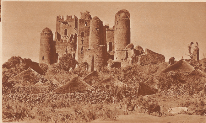
Das kaiserliche Abessinien. Urtes Schloss bei Goadar in der Provinz Amhara, das einem Vorfahren Menelik als Wohnsitz diente. Das kaiserliche Hauptquartier: ausgerichtet in die Landschaft hinein. Um die abessinische Burg herum stehen gruppenweise die kegelförmigen, mit Stroh bedeckten Steinhäuser der Eingeborenen.