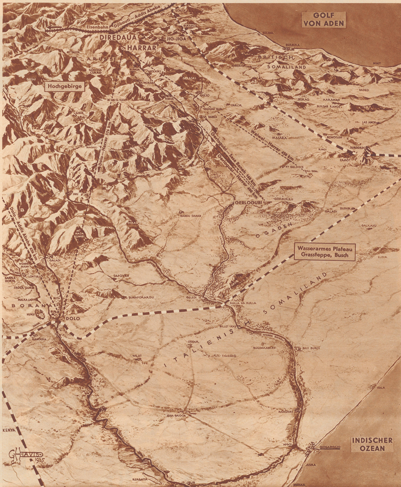
Reliefkarte der Gegenden der italienischen Kriegsoptionen in Somaliland. An der Südfront stehen unter dem Kommando von General Graziani ebenfalls drei italienische Armeekorps mit rund 100 000 Mann. Die Basis für alle Aktionen in Somaliland ist die Hafenstadt Mogadiscio. Nach offiziellen italienischen Berichten stehen italienische Truppen hier in 80–100 Kilometer Tiefe auf abessinischen Gebiet. Die strategisch wichtigsten, bis jetzt besetzten Punkte auf der Somalifront sind Gerlogubi und Dolo. Gerlogubi wurde, bevor es besetzt wurde, durch Fliegerbomben vollständig vernichtet. Dolo liegt am Kreuzungspunkt von drei Wasserwegen und seine Besetzung weist daraufhin, daß die Italiener die Flüsse für ihren Vormarsch auf Addis Abeba zu benützen gedenken. Ebenso zeigt die Besetzung Dolos deutlich, daß die Italiener danach trachten, die Grenze zwischen Aethiopien und Kenia unter ihre Kontrolle zu bekommen, was ihnen ermöglichen würde, alle Transporte von Waffen und Munition von Kenia zu unterbinden. Gerlogubi und Dolo liegen in der Ebene, waren also verhältnismäßig leicht zu erobern. Hinter den beiden Orten aber beginnt schon das Gebirge und damit auch die Schwierigkeiten.