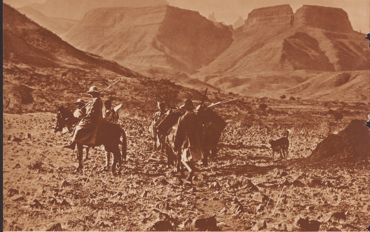
Die partidehen Fetzen des Negus. Es entspricht durchaus der Wahrheit, was ein guter Kenner Amharsiens bei Ausbruch des italienisch-abessinischen Konfliktes über die Bodengestaltung des Landes im Zusammenhang mit der Kriegführung geschrieben hat: «Die besten Volksteile der Abessinier in dieser Auswanderung, und die Klima und die eigentümliche Bodengestaltung des Landes. In der Tat werden die italienischen Eindringlinge, wo immer sie auch ihren Ein- und Vormarsch bewerkstelligen wollen, ganz schwere Hindernisse vorfinden. Abessinien ist ein Hochland, das durch weitläufige und bis zu 2000 Meter tief eingeschnittene Täler in eine Anzahl fast unzugänglicher Provinzen zerlegt ist. Auf drei Seiten ist das Hochland von gewaltigen Brandkästern begrenzt. Nach Norden geht Abessinien in das Gebirgsland von Erythra über, das sich zum Meer abwärts. Hier sind die Italiener bis jetzt auf einer Breite von 60 km etwa 30-40 Kilometer ins Land einmarschiert. Im Süden erhebt sich das Gebirgsland von Kaffa, im Westen führt das Hochland von Abessinien nach zum Hochland des Oussdas ab. Überall muß also zuerst die Geländegestaltung erobert werden und darüber erst kann der Vormarsch auf dem Hochland beginnen. Er wird besonders erschwert sein durch den völligen Mangel an brauchbaren Straßen. Das obige Bild zeigt einen Ausschnitt aus dem Semiengebirge, einem Landschaft, den die Italiener zu überwinden haben werden, wenn sie von ihrem jetzigen Stützpunkt bei Adala und Aksum aus zu den Tausen gelangen wollen.