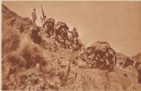
Mauslikerkarawane beim Übergang über den 3720 Meter hohen Seltipal. Das Bild gibt einen Begriff von den Strapazen und Beschwerden, die die Karawane in diesem Abessinien. Mit großer Mühe können die Träger in dem feuchten, vegetationslosen Gelände vor- und aufwärts. Nicht ausser Acht zu lassen die Einheiten einer fremden Invasionarmee mit allem komplizierten Drum und Dran vorwärtskommen sollen.

Aufnahmen: Jozef Bleichner. Abessinien: Photo-Archiv. München