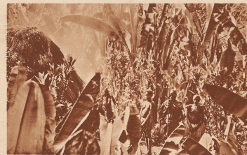
In der Provinz Kaffa, besonders in der Jamba-Niederung, die an den Sudan und an das Uganda-Territorium grenzt, gibt es Urwälder mit allen Merkmalen tropischer Urwälder. Hier wachsen alle tropischen Getreide, von der Banane bis zur Pfefferfrucht. Diese Urwälder sind bewohnt von den im Auswärtigen begriffenen Menschen. Sie leben verstreut in kleinen Gehäusen und sind äußere Eingliederung verweigert.