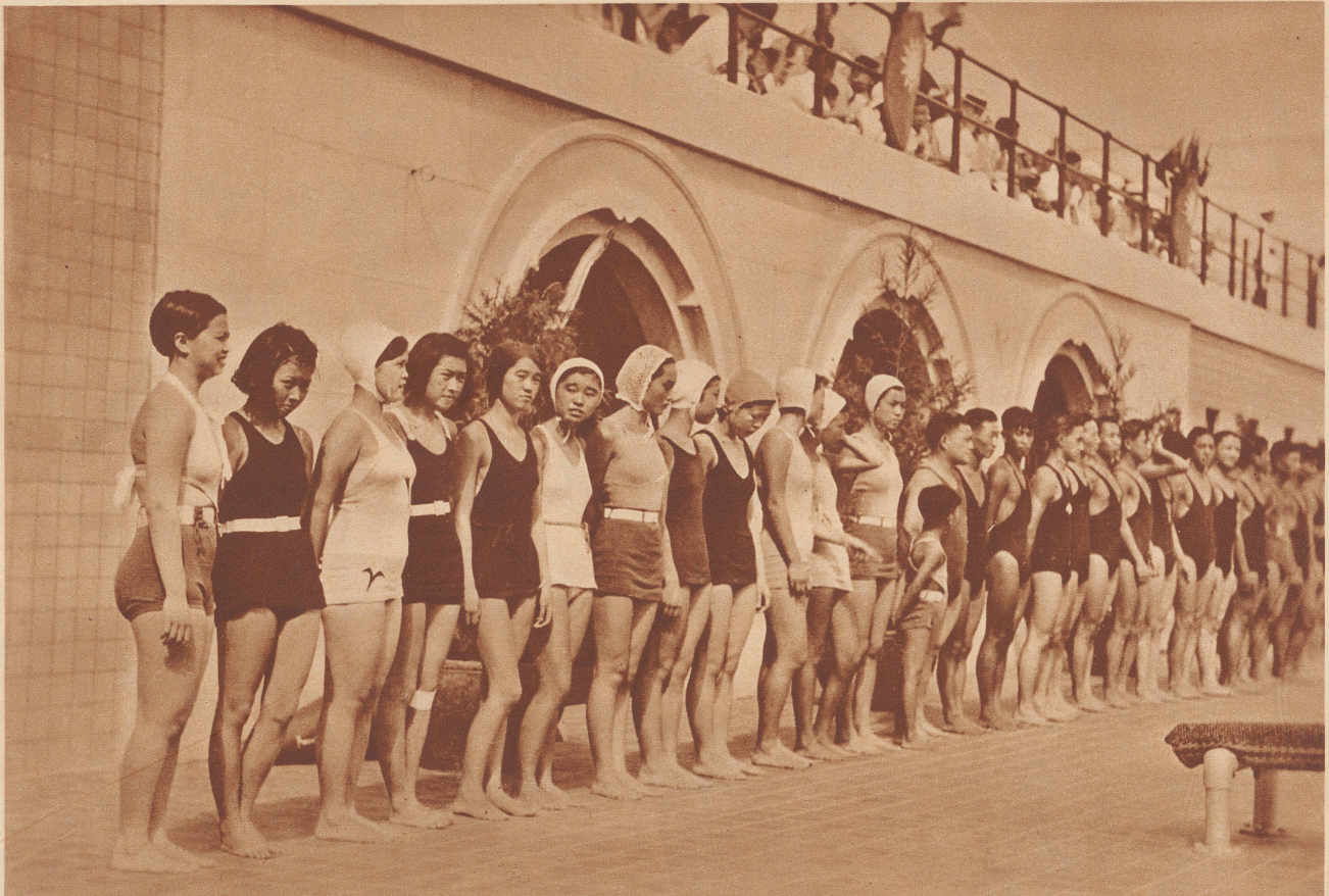
Chinesische Schwimmerinnen bei der Einweihung eines großen Schwimmbades nach westlichem Muster in Schanghai.