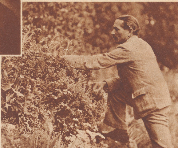
Der Dichter im Jahre 1934.

Gestern, am 14. November, wurde Jakob Schaffner, der gebürtige Basler, 60-jährig. Seine reiche dichterische Begabung hat sich im frühen Kampf gegen materielle und ideelle Widerstände so sieghaft durchgesetzt, daß er heute zu den «Großen» unter den lebenden Erzählern des deutschen Sprachgebietes gehört. In seinem Roman «Johannes» finden wir des Dichters Entwicklungskurve in einigen bedeutsamen Teilen nachgezeichnet. Wenn die wahren Dichtungen immer zugleich auch Bekenntnisse sind, dann sprechen neben «Johannes» auch die andern Romane und viele Erzählungen Jakob Schaffners überzeugend für das wahre Dichtertum ihres Schöpfers.