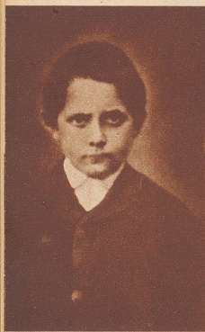
Jugendbild Jakob Schaffners.