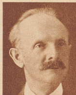
† Komponist Emile Lauber

In der besten Geschäftslage der deutschen Reichshauptstadt, Unter den Linden-Ecke Friedrichstraße, geht jetzt der Rohbau des «Hauses der Schweiz» der Vollendung entgegen. «Haus der Schweiz» heißt es darum, weil es von schweizerischen Interessenten aus schweizerischen Mitteln, die zurzeit wegen der bestehenden Devisengesetzgebung nicht nach der Schweiz transferiert werden können, erbaut ist, und weil der große, schöne Eckladen im Parterre, sowie die Ecke im 1. Stock vom Schweizerischen Verkehrsbureau, das heißt der offiziellen Agentur der Schweizerischen Bundesbahnen, bezogen wird, da die bisherige Niederlassung der S. B. B. Unter den Linden 57 sich räumlich als zu klein erwiesen hat. Das Haus wird inklusive Grund und Boden ca. 2 Millionen Mark kosten. Auf der Seite Friedrichstraße erhält es Arkaden wie die Häuser an der Berner Spitalgasse. Es wird gebaut nach den Plänen des Schweizer Architekten Meier-Appenzell (Mitarbeiter E. Bachmann, Schweizer Konsul in Düsseldorf). Den zweiten Laden im Parterre, sowie den Rest des 1. Stockes wird die italienische Schiffahrtsgesellschaft Cosulich Lines beziehen. Die übrigen fünf Stockwerke werden an private Interessenten vermietet.