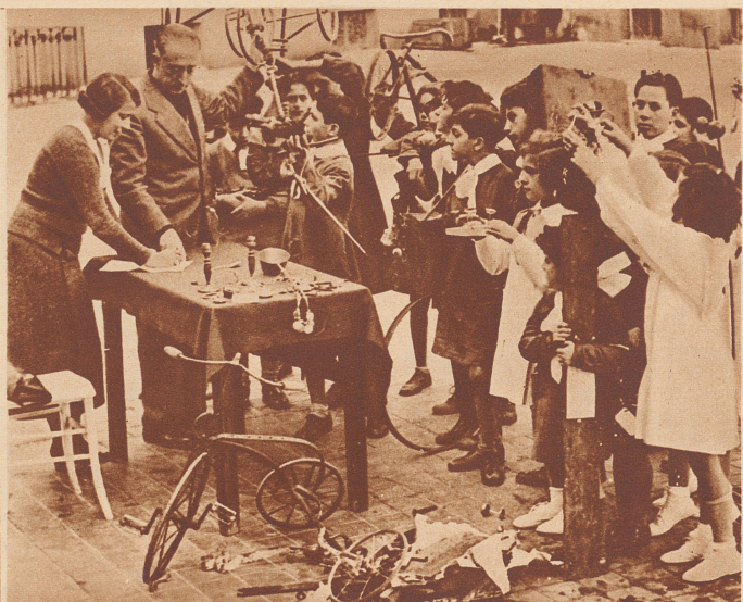
Alles, was aus Metall hergestellt ist, bekommt vermehrten Wert in Italien. Selbst die Kinderspielzeuge werden dem Vaterland geopfert.