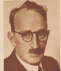
Walter Schaub Sekundarlehrer in Binningen, der sozialdemokratische Ständerat von Baselland.