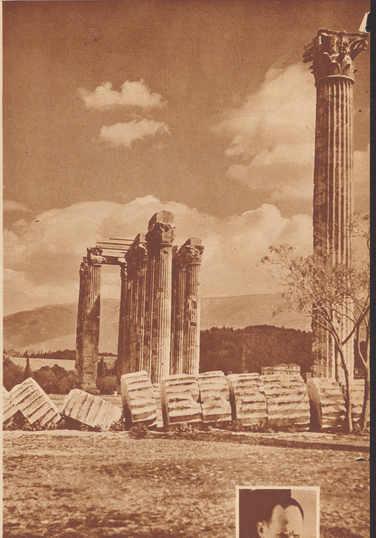
Als man noch keine Betontürme baute: Die Ruinen des Zeustempels vom Olympieion in Athen. Hinten links der Amphitheaterbau des modernen Stadions.