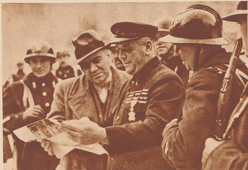
Ein wichtiger Zeuge im Prozeß: der Chauffeur, der am verhängnisvollen Tag, 9. Oktober 1934, das königliche Automobil in Marseille steuerte.