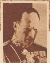
König Georg II. von Griechenland.