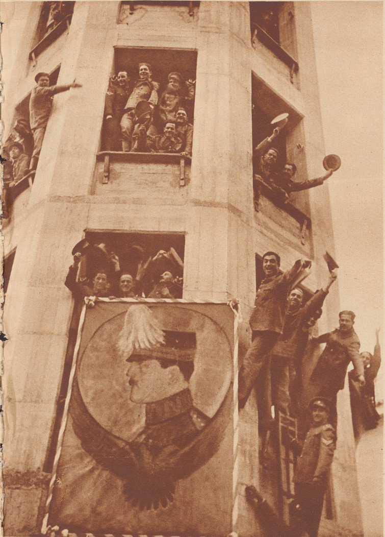
Am 3. November hat Griechenland die Wiederherstellung des Königtums beschlossen. Der griechische Kreuzer «Helli» hat König Georg II., von England kommend, in Brindisi abgeholt. Hunderttausend Personen sind aus den verschiedensten Provinzen Griechenlands nach Athen gereist, um den zurückgerufenen König zu begrüßen. Bild: Die Besatzung eines hochmodernen Feuerwehrturms in Athen in Erwartung des Monarchen.