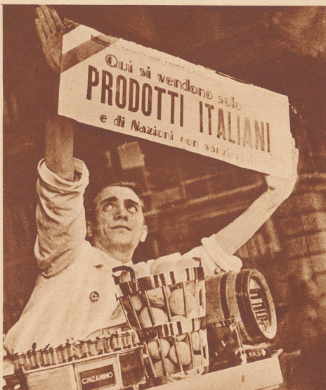
Nur noch italienische Produkte und Produkte der Nationen, die an den Sanktionen sich nicht beteiligen werden in diesem Laden verkauft. Das sagt deutlich das Plakat, das dieser Negoziant ausgehängt hat.