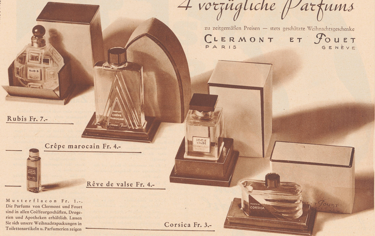
Rubis Fr. 7.-