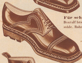
Für schlechtes Wetter Boxcalf braun mit Hartgummisohle. Rahmenarbeit Fr. 19.80