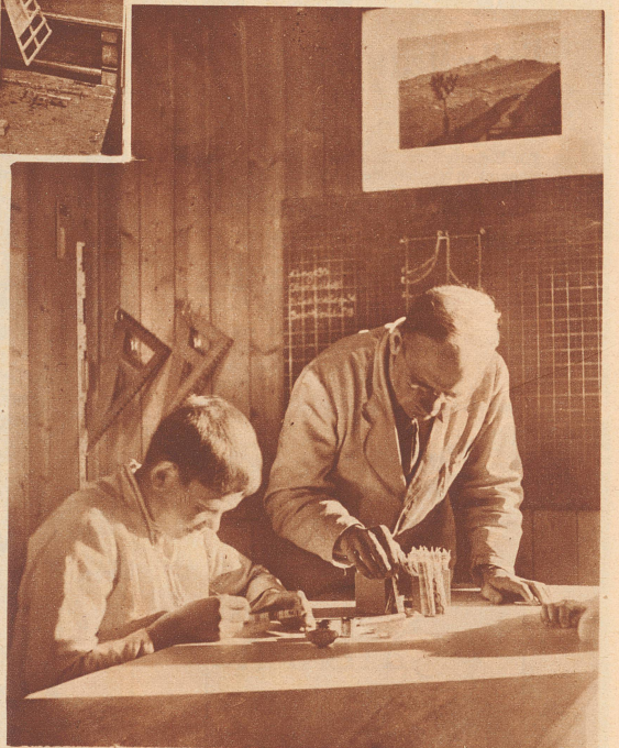
Im Toggenburg macht der Lehrer einer Bergbauerschule mit seinen Schülern ebenfalls Weihnachtssachen. Da werden Kerzen bemalt und Schachteln und kleine Truhen verziert. Die Kinder schaffen mit Begeisterung für das Christkind und können ihren Eltern, die oft sehr arm sind, dafür manchen Batzen heimbringen.

Liebe Kinder! Als Gritli acht Jahre alt war, vernahm es zum erstenmal, daß die schönen Spielsachen, die es an jedem Weihnachtsfest erhielt, nicht vom Christkind, sondern daß die größten und teuersten Geschenke vom Vater und die anderen von Tante Emma, Onkel Rudi und vom Götti gewesen seien. Das stimmte Gritli doch ein wenig traurig, denn es hatte bis jetzt fest an das Christkind geglaubt. Es war doch viel schöner zu denken, daß die Sachen vom Himmel herunterkamen, als wie sich jetzt herausstellte, daß sie im Spielwarenladen gekauft wurden. Aber gewiß war das Christkind dabei, als die schönen Geschenke gekauft wurden, sie waren ja in goldenes Papier gehüllt und mit Silberschnüren festgebunden. Zwei Jahre später vernahm Gritli auch noch, woher die Spielsachen kamen. Es hörte davon, daß es in Deutschland, im Thüringerwald ganze Dörfer gäbe, in denen fast nichts anderes als Spielzeuge hergestellt würden. Wie staunte es, als ihm Vater erzählte, es gäbe da sogar Spielwaren-Schulen, in denen Mäd-