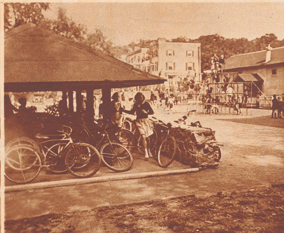
Die Spielstunden in amerikanischen Schulen sind eine äußerst vergnügliche Angelegenheit. Turngeräte und ein ganzer «Velopark» stehen den Kindern zu freier Verfügung.