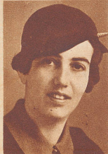
† Annelies Stoffel-Schuster die bekannte schweize- rische Turnierreiterin, starb in London an den Folgen des Typhus.