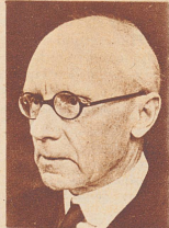
Sir George Warner der neue englische Ge- sandte bei der Eidgen- ossenschaft.