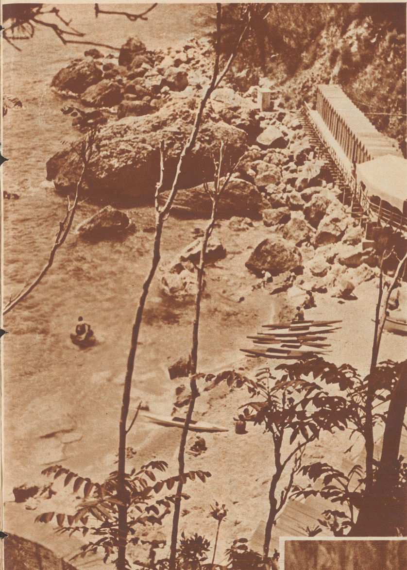
Die ringsum steil abfallende Felsenküste der Insel ist da und dort von kleinen reizenden Badestellen unterbrochen. Eine Anzahl Sandolinos liegen am Strande für den Besucher zu einer kleinen Küstenfahrt bereit.