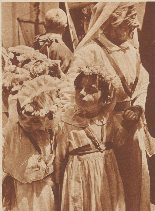
Urgroßmutter und Enkelkind im Festzug nebeneinander. Bei weltlichen und kirchlichen Festen, von denen es besonders von den letzteren eine Menge auf der Insel gibt, tragen die Kleinen einen Blumenkranz, die Alten einen weißen oder gelben zurückgeschlagenen Schleier.