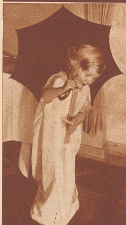
... schon immer voll Humor!