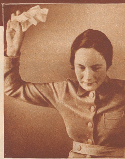
Weg muß der ganze Zettelmist!

Machen Sie also mit! Füllen Sie heute noch den nebenstehenden Bestellchein aus, damit Sie sofort das blaue Haushaltbuch erhalten.