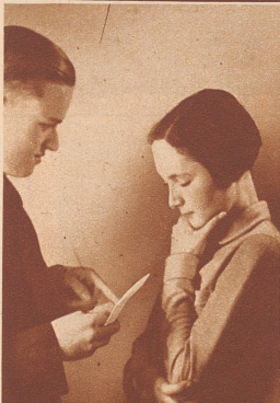
... da gab's den ersten Streit!

Marliese war als kleines Kind schon immer voll Humor; Sie wuchs nach allen Seiten hin, doch größtenteils empor, Und als sie tausend Wochen alt, da war sie schön und schlank, Die Männer aber in der Stadt die wurden liebeskrank. Doch wählt Marlies mit Kennerblick den Fritz, den Kaufmannssohn; Der trat mit ihr zum Traualtar denn das ist guter Ton. Und als die Eh' ein Jahr alt war, da gab's den ersten Streit, Ihr fehlte von dem Haushaltgeld nur eine Kleinigkeit. Viel war's ja nicht - doch immerhin genug für ihren Mann, Der seinerseits nun mit Gefluch ein groß Geschrei begann. Marliese aber, wie sie war, dacht sich mit viel Humor: