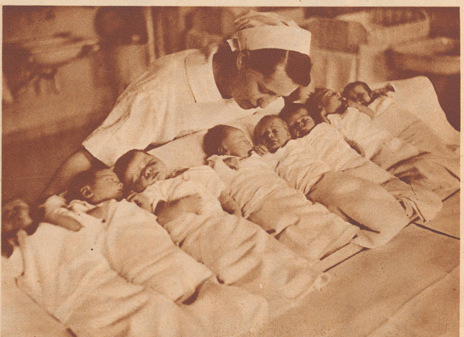
... wünscht in der Frauenklinik die Säuglingschwester den Neugeborenen der Silvesternacht.