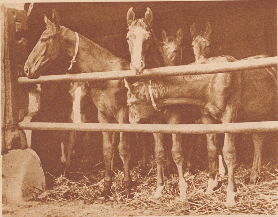
Jung und alt nebeneinander im Stall. Die Enge der Boxe lieben diese Pferde nicht. Ihr Sinn geht nach Weite, Bewegung, Grenzenlosigkeit. Aus ihren Augen leuchtet die Sehnsucht nach der Weide.