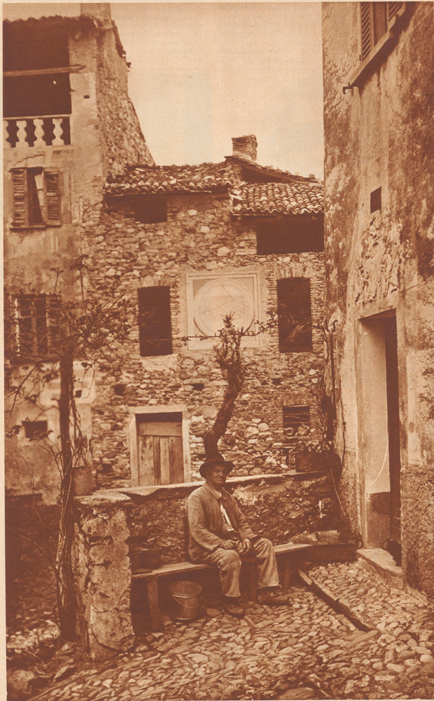
Diesem idyllischen Dorfwinkel in Ciona bei Carona würde etwas fehlen, wenn die Sonnenuhr nicht da wäre.

Hut ab vor den Leistungen unserer jurassischen Uhrmacher! Aber es gibt noch etwas Höheres, als unser Alltagsleben auf Minuten und Sekunden genau einzuteilen — um nicht zu sagen: sich dem Stundenschlag zu versklaven. Das lehrt uns das Land der Sonnenuhren, wo das Räderwerk importierter Tick-tack-Ware einrostet, bis es stillesteht, weil der Mensch dort noch näher mit der Natur verbunden ist und sein Tagewerk mit dem Hahnenschrei beginnt und mit der sinkenden Sonne beschließt. Glücklicherweise diese Menschen, die mit dem erwachenden Licht ihre Augen ausreiben und ihre Glieder strecken und nicht durch Weckergerassel und dröhnende Eisenbahnen aus dem Schlummer gerüttelt werden, die für das «Zeit ist Geld» nur ein Lächeln übrighaben, weil sie sich sträuben, die goldene Zeit in schmutziges Geld umzuprägen und sich vom ruhelosen Ticktack durch Stunden und Minuten hetzen zu lassen.