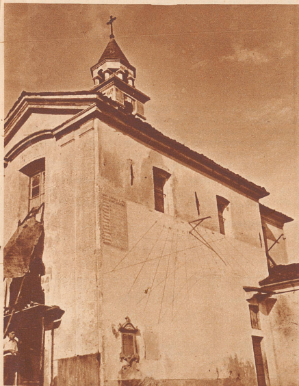
Wer in Banco die genaue Zeit wissen muß, begibt sich zur Kirche und richtet seine Uhr nach der Sonnenuhr, dem rechnerischen Werk eines Einheimischen.

So ist noch manche dieser Sonnenuhren mit der Orts- oder Familiengeschichte eng verknüpft. Frr.