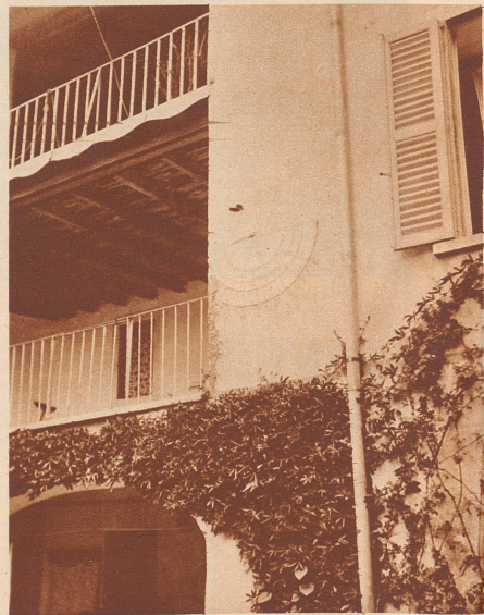
Ein Wirt in Meride am Monte San Giorgio rühmt die Sonnenuhr als genau, denn sein Vater habe sie selbst unter genauer Kontrolle der Schattenwürfe an die Mauer des Hofes gemalt.

Reizvoll ist es, der Geschichte einzelner Sonnenuhren nachzugehen. Viele sind Jahrhunderterte alt. In Breganzona las ich am Haus Crivelli die Jahreszahl 1731; in Arosio, hoch oben im Malcantone, 1664. Die Kirche Banco bei Novaggio hat ihre Sonnenuhr vor etwa 10 Jahren bekommen. Ihr Meister ist der einheimische Ingenieur Ferretti, der sich im hohen Alter von über siebenzig Jahren nach arbeitsreichem Leben im In- und Ausland in sein Heimatdorf zurückzog und sich astronomi-