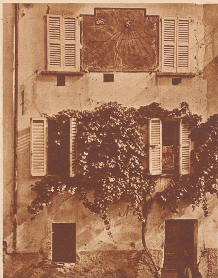
Das Haus Crivelli auf dem Dorfplatz von Breganzona kündigt seit zwei Jahrhunderten den Bewohnern die Zeit an.