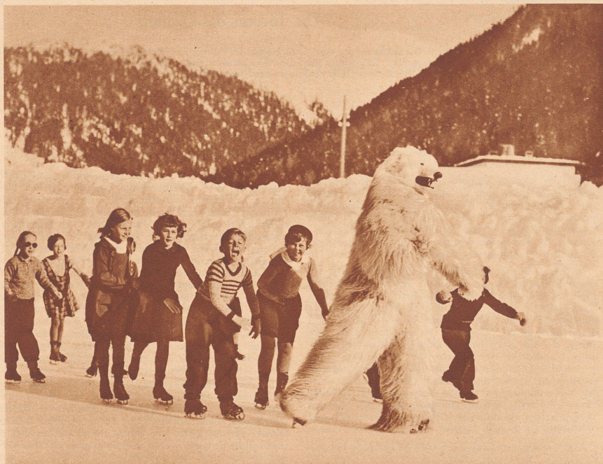
Der schlittschuhlaufende Eisbär

Jetzt machen wir einmal einen «Gump» in den hohen Norden Europas und statten dort einem Lappländer Schulhaus einen Besuch ab. Der kleine Ort in Schwedisch-Lappland heißt Vaisaluokta und liegt irgendwo am 68. Breitengrad. Der Schulinspektor braucht zwei Tage, bis er mit dem Motorboot die vielen Seen durchfahren hat, die nach Vaisaluokta führen. Wer etwa glaubt, hier wie bei uns Schulpaläste zu finden, die über eine Million Franken gekostet haben, der irrt sich. Zwischen einem Schneeberg und einem silberblauen See stehen drei kleine Erdhütten. In einer Hütte schlafen die Kinder, in der zweiten wird gegessen und in der dritten wird eben Schule gehalten. Die Lehrerin ist eine junge Schwedin, die hier von Juni bis September unterrichtet. Wir