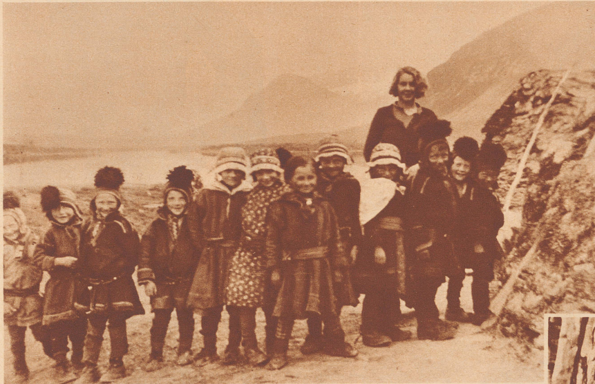
Die Nomadenkinder und ihre schwedische Lehrerin vor der Schulhütte. Dahinter liegt ein See und das Akka-Bergmassiv, wo es noch Bären gibt.