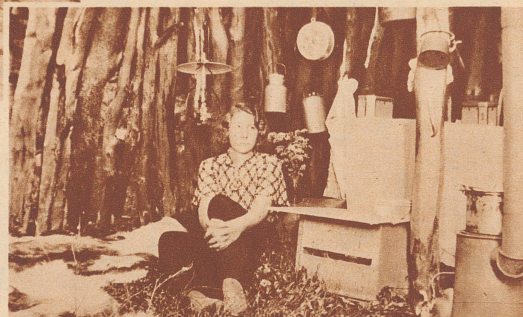
Die junge schwedische Lehrerin, die von Juni bis September die lappländischen Kinder im Sommerlager unterrichtet, wohnt in einer Erdhütte. Möbel hat sie nicht, sie schläft wie die Lappen auf Reisig und Renttierfellen.

Lehrer: «Walter, wie kommt es, daß dein Aufsatz über den Hund fast wörtlich mit der Arbeit von Fritz übereinstimmt?»