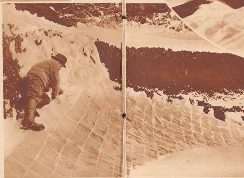
Kurvenmauerung mit Eisriegeln an der Olympiabobbahn in Garmisch-Partenkirchen.