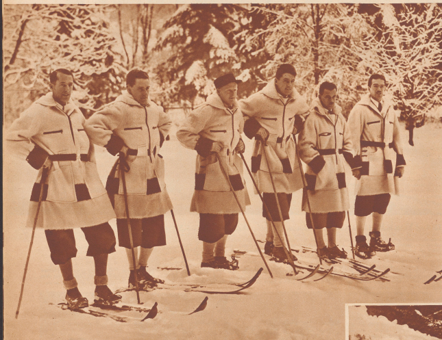
IV. Olympische Winterspiele in Garmisch-Partenkirchen vom 6.-16. Februar 1936