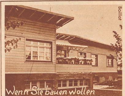
Wenn Sie bauen wollen