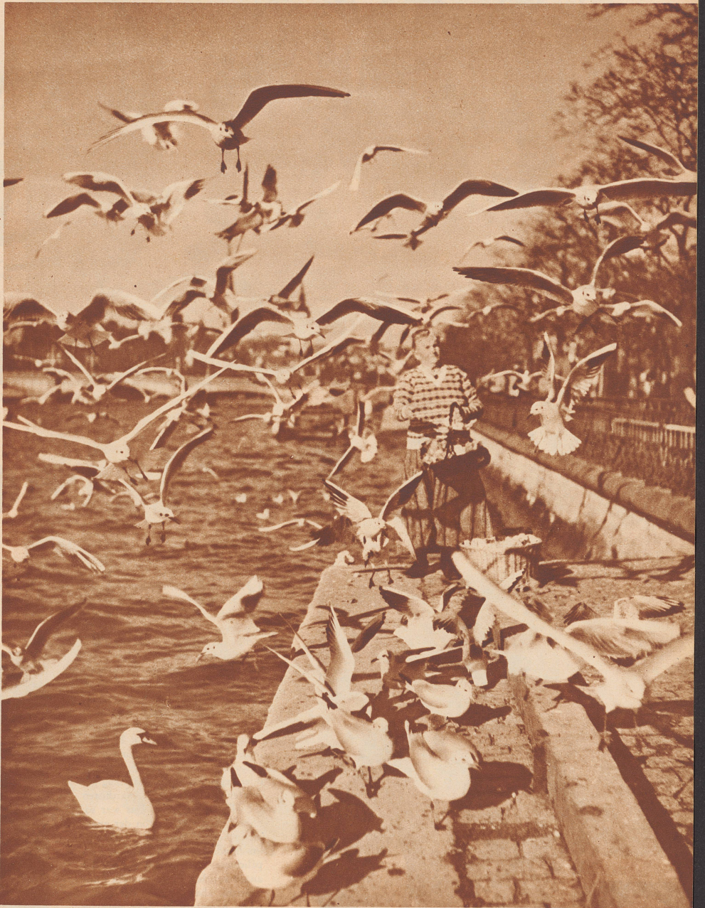
Ein riesiger Schwarm weißer Möven stürzt sich im Flug auf die Speisen, die ihnen die gute Frau jeden Nachmittag von 12–13 Uhr reicht.

Da steht ein Baum an der Straße, der trägt einen schneeweißen Streifen um die Rinde des Stammes. Habt ihr auch schon solche Bäume bemerkt? Weshalb streicht man sie weiß an?