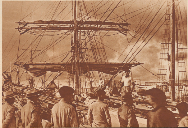
Im Hafen von Lissabon. Ein Blick auf den großen Segler vorer den tropischen Sonne über in die große leuchtende Vergangenheit Portugal, in die Zeit, da diese berühmten Seefahrer Diego Cao, Alvarez Cabral, Bartholomäus Diaz und Vasco de Gama ihre kleinen Fahrten über die Ozeane aufzubrechen und in Afrika, Indien und Südamerika eine Fernhandelswege für das Mutterland schufen.