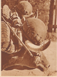
Der ledere Koyfischmak. Das schwerfällige Nadelgehölzpolster einen Ochsengepannen, das von der Landeshut Wien in die Sech führt.