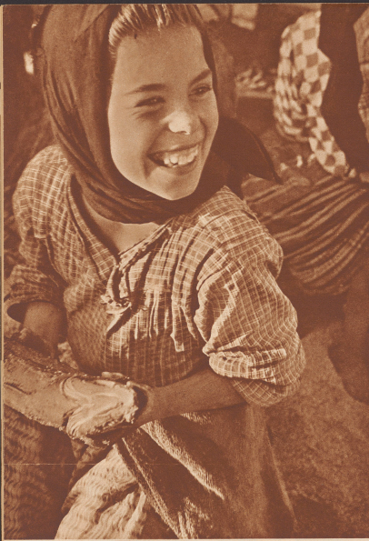
Fischmarkt auf dem Fischmarkt von Lissabon. Altm um der schwarzen Augen und der leuchtenden Lächeln will man ihn für ein paar Escudos ab.