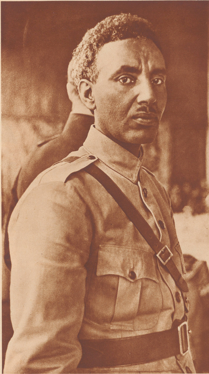
Ras Nassibu Zamanuel