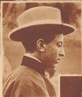
Kronprinz Asfa Wosen