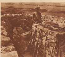
Gefangene abessinische Krieger aus der geschlagenen Armee des Ras Dena Schibnegnewe. 40000 Mann stürzte diese Armee, Rand 5000 davon fielen bei der Schlacht am Dawa. Perma und am Gauda. Die, rund 10000 wurden gefangen genommen oder haben sich ergeben.