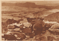
Dieser der mehrere Wochen im weitesten vorgeschobenen italienischen Machtschutzelposten an der Erythrafront bei Ma Zagra. Er befindet sich vier Kilometer vor Makalle auf einem Hügel, von wo aus die dazugehörige Ebene gut übersehbar war und leicht mit Machtschutzelposten besetzt werden konnte. Seit der großen Schlacht am Amba Aradam ist die Front auch an diesem Hügel wieder nach Süden und Südosten vorgeschoben worden, und Ma Zagra hat das Renommee, der vordersten Posten an der Nordfront zu sein, zugebilligt.

Über die beiden bedeutendsten Aktionen in diesem bald fünf Monate dauernden Krieg in Ostafrika: den Novosib Grotzian an der Südfont, und die große Schlacht vor Makalle an der Nordfront, hat uns die Tagespresse ganz gründlich berichtet. Jedoch, so ist unendlich wie streng in den Hauptquartieren der beiden kriegführenden Parteien die Zensur über die Produkte der Presse-photographie gehandhabt wird. Seit vielen Wochen sind keine guten Kriegsbilder, weder vom nördlichen noch vom südlichen Kriegsschauplatz — und schon gar keine von den vordersten Linien der Fronten — nach Europa gelangt. 150 Zeitungsschreiber und Photographen aus aller Welt halten sich allesamt auf italienischer Seite an der Erythrafront auf. Keine Zeile, kein Telegramm und kein Foto kann weggeschickt werden, ohne die Zensur passieren zu haben. Die wenigen Bilder, die wir hier zeigen, hat uns neben ein Berichtszusatz mitgebracht, der seit Ausbruch des Krieges auf dem nördlichen Kriegsschauplatz welche den Vormarsch der Italiener in der Provinz Tigre unter General de Boas mitgemacht hat und bis unmittelbar vor der großen Schlacht am Amba Aradam bei allen Aktionen der Italiener im Makalle-Abschnitt zuweisen in den vordersten Linien dabei gewesen ist.