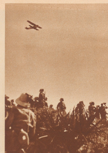
Italienische Bersagliere-Truppen rücken in Begleitung von Bombenflugzeugen gegen den Takareffluß vor. Das Flugzeug ist ein Caproni-Bomber. Während des Vorrückens stehen die Truppen mit dem Flugzeug in ständiger Verbindung. Das Flugzeug hat die Aufgabe des Geländes, das die Truppe passieren will, genau nach feindlichen Abteilungen oder Vorposten abzusuchen und sie mit Maschinengewehrfeuer oder Bomben auszugreifen und zu zerstören. Das ist relativ leicht in einem mit spärlicher Vegetation besetzten Steppengelände, aber sehr schwer, wenn das Terrain gebirgig und waldig ist.