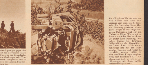
Ein alltägliches Bild für den, der von Amara oder Adara nach vorne zu die Fronten. Zu Dutzenden liegen über die Böschung gestürzte, demolierte Wagen in den ausgetrockneten, halbtrockenen und auf den Talböden. Dieser Wagen stürzte kurz hinter Adara über eine kaum 20 Meter hohe Böschung. Nur selten stürzen bei dergleichen Mitgedächten die Wagenführer am Leben. Rund 11000 Meter verhalten wurden. 10000 für den nördlichen Kriegsschauplatz 1000 nach Somaliland, 12-15000 davon sind bei hier in der Abessinien, nur durch Unfälle abtunbar geworden.