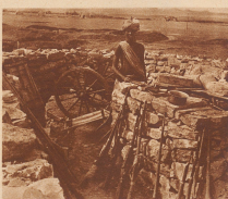
Gefangene abessinische Krieger aus der geschlagenen Armee des Ras Dena Schabazegnere. 40000 Mann stürzte diese Armee, Rand 5000 davon fielen bei der Schlacht am Dawa. Ferner aus Guala Dera, rund 10000 wurden gefangen genommen oder haben sich ergeben.

Über die beiden bedeutendsten Aktionen in diesem bald fünf Monate dauernden Krieg in Ostafrika: den Novosib-Graziani an der Südfrente, und die große Schlacht vor Makalle an der Nordfront, hat uns die Tagespresse ganz gründlich berichtet. Jedoch, so ist unendlich wie streng in den Hauptquartieren der beiden kriegführenden Parteien die Zensur über die Produkte der Presse-photographie gehandhabt wird. Seit vielen Wochen sind keine guten Kriegsbilder, weder vom nördlichen noch vom südlichen Kriegsschauplatz — und schon gar keine von den vordersten Linien der Fronten — nach Europa gelangt. 150 Zeitungsschreiber und Photographen aus aller Welt halten sich allesamt auf italienischer Seite an der Erythrafront auf. Keine Zeile, kein Telegramm und kein Foto kann weggeschickt werden, ohne die Zensur passieren zu lassen. Die wenigen Bilder, die wir hier zeigen, hat uns soeben ein Berichtszustatler mitgebracht, der seit Ausbruch des Krieges auf dem nördlichen Kriegsschauplatz weite, den Vormarsch der Italiener in der Provinz Tigre unter General de Boas mitgemacht hat und bis unmittelbar vor der großen Schlacht am Amba Aradam bei allen Aktionen der Italiener im Makalle-Abschnitt zuweilen in den vordersten Linien dabei gewesen ist.