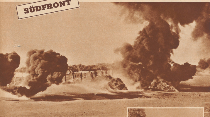
Die Bombardement von Neghelli. 12 Tausend Bomben sind bei mehreren Luftangriffen von 24 italienischen Flugzeugen auf Neghelli abgeworfen worden. Tags darauf griffen die Italiener an, und dann besetzten die Fallschirmjäger General Graziani - Akaki und Schwachstein - die Ouedsch.