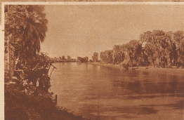
Der Webbi Schabeli, der bedeutendste Fluß in Somaliland. Er ist bis weit in abessinische Oueden hinein schiffbar. Seine Ufer strecken von tragischen Pfanzensapfeln. Für die von ihm durchflossenen abessinischen Provinzen und italienisch-somaliland ist er so wichtig wie der Nil für Ägypten.