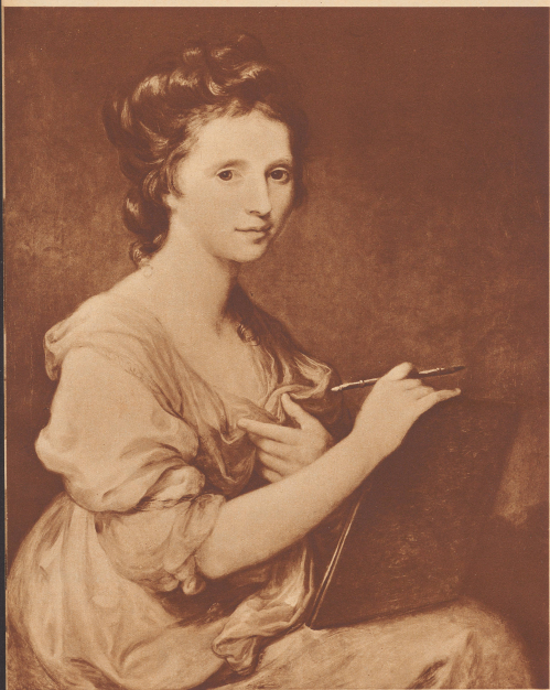
Selbstporträt von Angelica Kauffman.

Es hängt in der »National Portrait Gallery«, wo sonst nur Bildnisse der bedeutendsten englischen Persönlichkeiten aufgehoben werden.