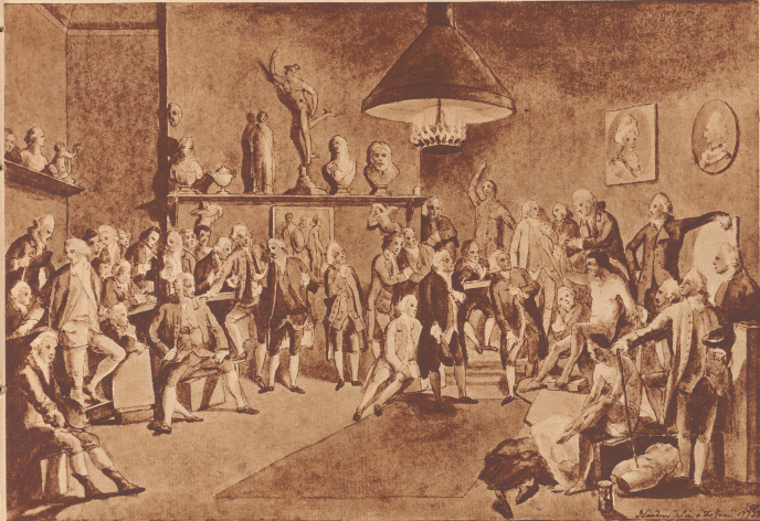
»Das lebende Modell«.

Zeichnung nach dem Gemälde von Zoffany (1772). Ständige Mitglieder der »Royal Academy« sind auf diesem Bilde zu sehen. Der Schweizer Moser ist der Mann, der die Hand des Modells hält. Der Mann vorne rechts im Bilde, mit dem Sperrstock in der rechten, ist der großgrobhauende Nathaniel Hone, ein abgeleiteter Liebhaber der Angelica Kauffman. Die beiden weiblichen Mitglieder der Akademie, Angelica Kauffman und Mary Moser, sind nur in der Form zweier Porträts zu sehen, denn es wäre von allen damaligen Engländern als unerbittlich »obskure« empfunden worden, wenn die beiden Damen in Gegenwart eines nackten männlichen Modells sich periodisch unter diesem Mäusenotlogium befinden hätten.