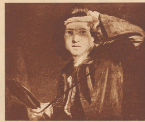
Selbstporträt Sir Joshua Reynolds des damals größten englischen Malers.