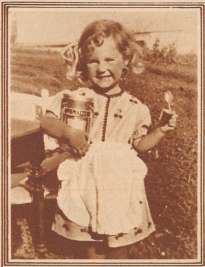
1. Der Doktor kommt zur Puppe und zum Bär, weil sie immer müde sind.

Hubert, der im Speisezimmer geblieben war, begluechte den jungen Mann von ganzem Herzen. Es mochte schrecklich für ihn sein, immer darauf zu warten, wann der Irr-