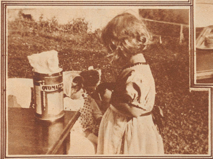
3. und dann erhält jedes ein wenig Ovomaltine zur Kräftigung.