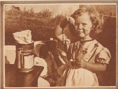
4. Schliesslich trinkt der Doktor die Ovomaltine selbst aus, weil sie so gut schmeckt.