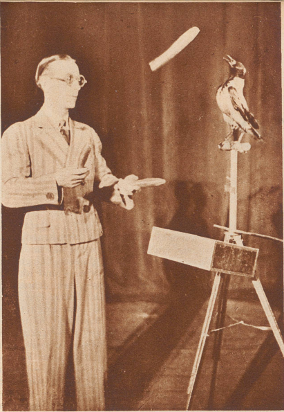
Ein Herr Nova brachte einer Nebelkrähe das Jonglieren mit kleinen Bällen und Keulen bei. Wie er das Kunststück fertig brachte, das erzählt euch hier der Unggle Redakteur.