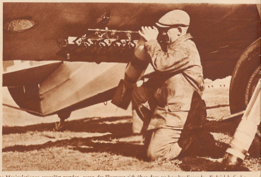
Rechts: Schwere Beobachtermaschine mit der Aufhängewindung für große Sprengbomben. Sie können vom Beobachter aus durch einfache Manipulationen ausgelöst werden, wenn das Flugzeug sich über dem zu bombardierenden Erdteil befindet.