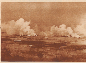
Die Zersplitterte nach der Explosion der abgeworfenen Bomben.