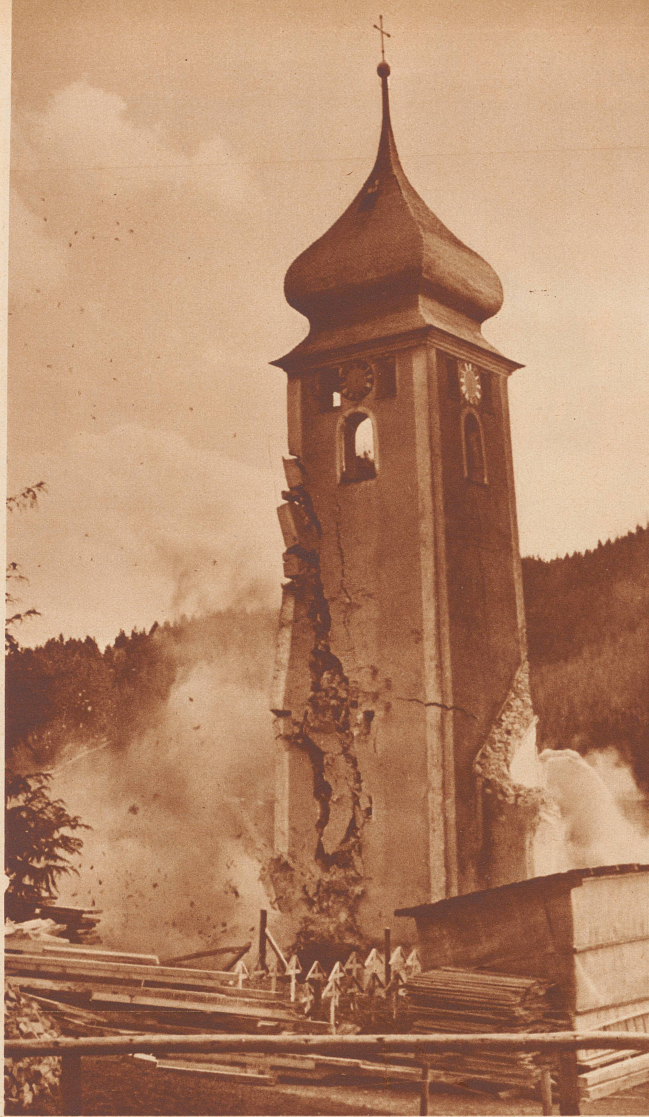
Am 24. März genau 12 Uhr 15 Minuten geht die Ladung los, der Turm schwankt, bekommt Risse, neigt sich nach drei Sekunden schon merklich nach links.