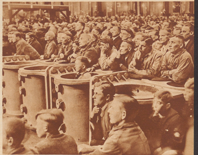
Die Arbeiter der Krupp-Werke in Essen hören Adolf Hitlers Wahlrede am 27. März 1936.