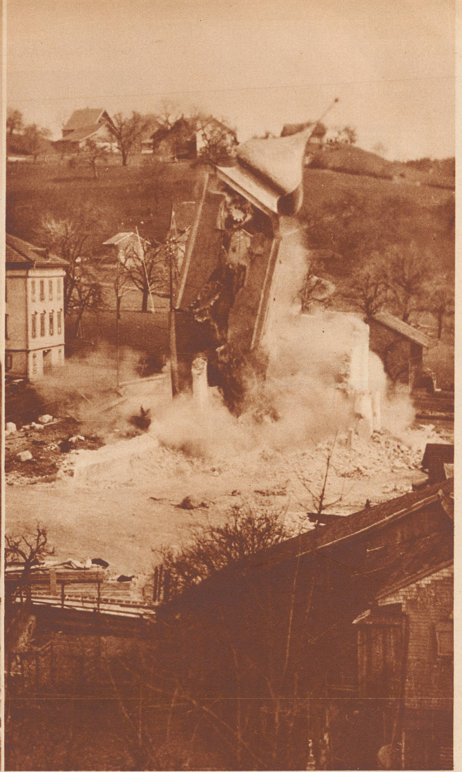
12 Uhr 15 Minuten 7 Sekunden: Der Turm ist geknickt, er fällt mit lautem Krachen, umhüllt von einer mächtigen Staubwolke, zusammen, die Kuppel löst sich, stürzt und bleibt zerschmettert etwas abseits von Schutthaufen liegen. 19 Sekunden hat das Schauspiel gedauert.