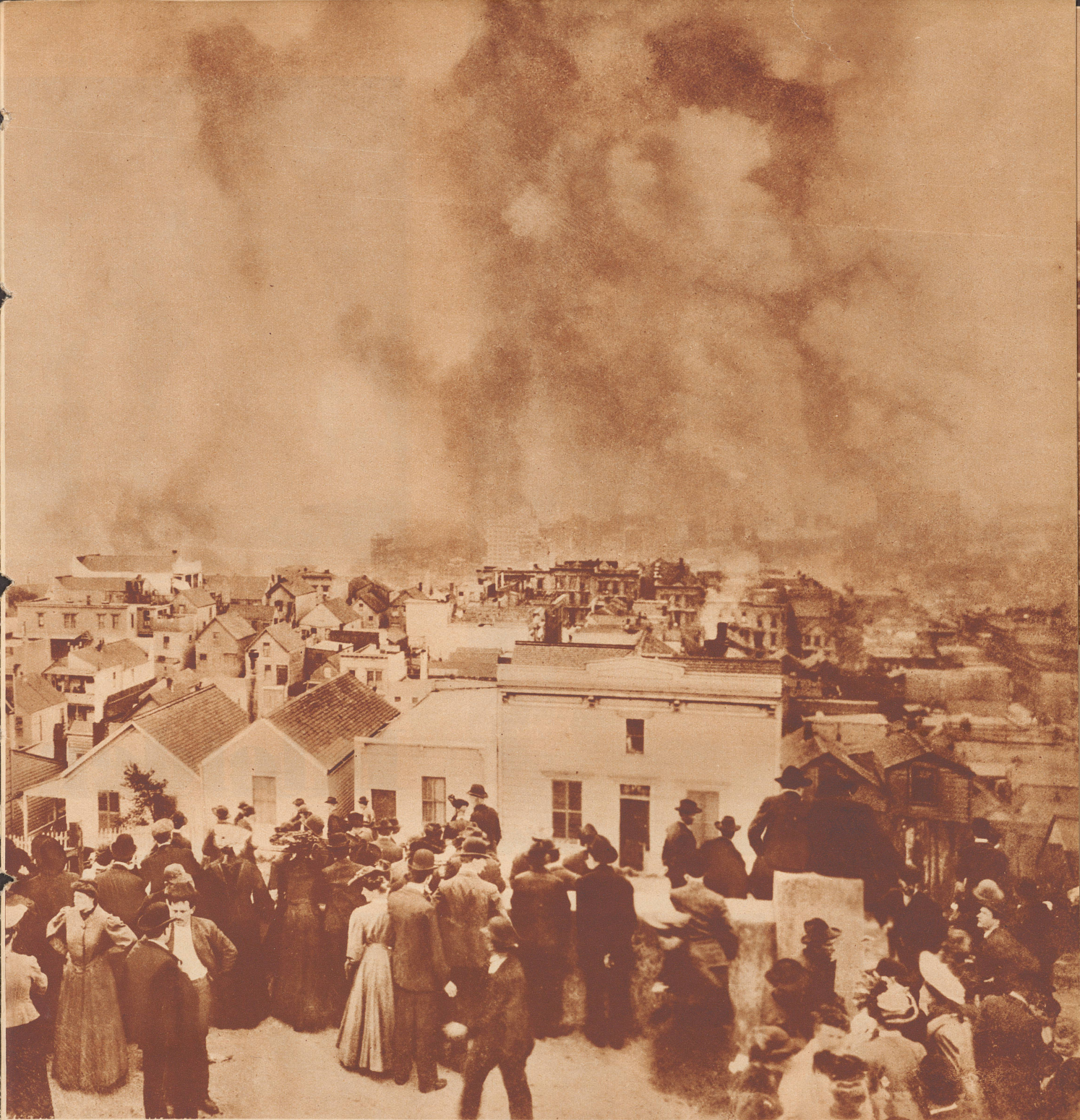
Blick auf die brennende Stadt San Francisco.