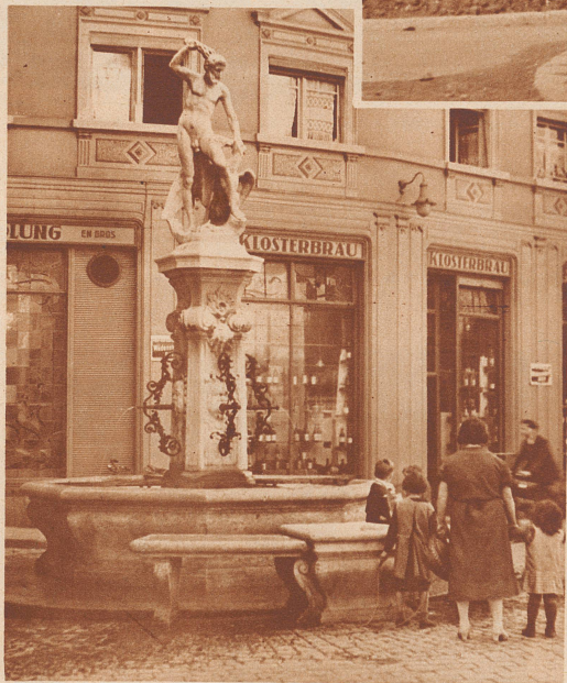
Der Brunnen am Neumarkt ist um 1750 entstanden. Sein Postament trägt als mythologische Gestalt den blitzschleudernnden Jupiter. Er stemmt seinen linken Fuß an einen Baumstamm, auf dem ein Adler mit ausgebreiteten Flügeln sitzt. Ein zierliches eisernes Rankenwerk stützt die vier Brunnenröhren. 200 Jahre vorher krönte eine Figurengruppe mit Löwen und Affen den steinernen Brunnen.

Erwartung des Ankömmlings, freundlichen Willkomm zu finden, nicht enttäuscht. Fremde rühmen den Brunnenreichtum Zürichs. Damit beweist die Stadt, daß sie das Labsal frischer Quellen zu schätzen und auch zu spenden versteht. Es ist ihr auch nicht gleichgültig, in welchem Gefäß sie den Gratstrunk verabreichen kann, so wenig als sie ihren Gästen den Ehrenwein der Stadt in billigen Wassergläsern kredenzt.