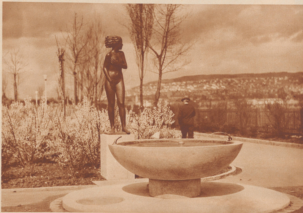
Zürich baut sein linkes Quaiufer zu einer herrlichen Grünanlage bis nach Wollishofen aus. Eine weibliche Figur von Bildhauer Otto Münch, hinter einfachem Brunnenbassin freistehend, den Blick gegen die Stadt gewendet, steht als köstlicher Unterbruch zwischen zwei blühenden Anlagen. Der schöne Brunnen legt Zeugnis ab für den Kunstsinne des Städtischen Wasserwerks.

Der erste Gang, den ein müdgelaufener verstaubter Wandersmann tut, wenn er endlich das Ziel seiner Reise, ein Dorf oder eine Stadt erreicht hat, — er rastet am Brunnen, kühlt seine heißen Schläfen, stillt den Durst und säubert Kleider und Schuhe, so gut es geht. Der Brunnen ist der Erste, der die heimliche