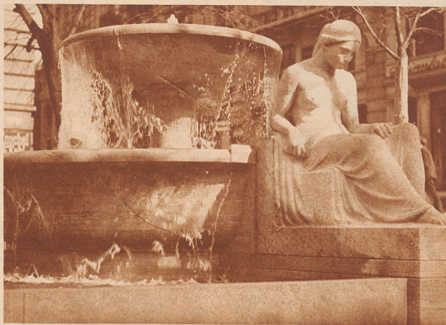
Der Platz zwischen Rämli- und Waldmannstraße wurde 1935 durch einen Monumentalbrunnen von Bildhauer Ed. Zimmermann verschönert. In der Anlage kommt das kurzweilige Spiel des Wassers, den Rand von Schalen überfließend, schön zum Ausdruck. Die beiden sitzenden weiblichen Figuren, die das Wasserbassin flankieren, bilden einen beruhigenden Kontrast zu den bewegten Wassermassen. Leider kann der große Brunnen auf dem kleinen Platz nicht recht zur Geltung gelangen.

Die Phantasie- und Geschmacklosigkeiten beim Uebergang des 19. zum 20. Jahrhunderts, neugotischer, klassizistischer Stil und der Jugendstil formten die Brunnen zu unerfreulichen Gebilden, bis die Amtsstelle der öffentlichen Trinkwasserversorgung die Brunnen als amtliche Standardwerke serienweise in steinerne Obeliskform oder als gußeiserner verschörkelte und mit dem Stadtwappen verzierte Turmgehäuse herstellen ließ. Zum Glück verschwindet im letzten Jahrzehnt einer nach dem andern von diesen lieblosen Amtsbrunnen. Die Stadt hat den besten Bildhauern von Zürich die freie Gestaltung von einzelnen Trinkbrunnen in Auftrag gegeben, in der Einsicht, daß auch Brunnen kleine Sehenswürdigkeiten sind, die das Bild einer Stadt beleben und bereichern. So ist das Wassertrinken an manchen Brunnen der Stadt, wie in frühern Jahrhunderten, wieder zum künstlerischen Genuß geworden.