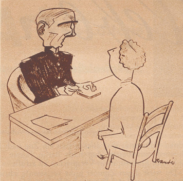
Die Statistik verwirrt die Köpfe.

«Wieviele Kinder haben Sie?» «Drei – aber mehr gib't auf keinen Fall.» «Warum denn nicht?» «Ich habe gelesen, daß jedes vierte Kind, das zur Welt kommt, ein Chinese ist.»