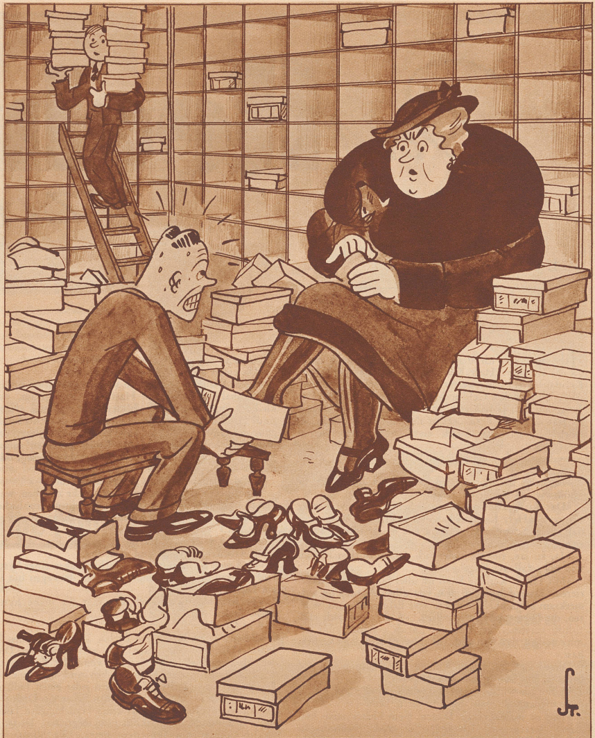
Ein Verkäufer verliert die Geduld.