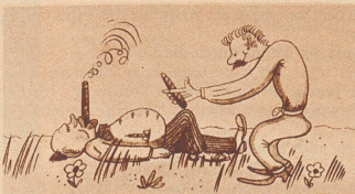
«Gestatten... darf ich Sie um Feuer bitten...?»

Sie wirft ihm einen wütenden Blick zu, winkt dann einem Auto und befiehlt dem Chauffeur mit lauter Stimme: «Fahren Sie mich sofort nach Hause, Seefeldstraße 14, 3. Stock, rechts.»