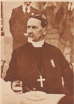
Der norwegische Bischof Stören.