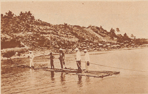
Eine ganz primitive Bambus-Fähre in Zentral-Java.

flochten. Ueber den Fluß ist ein Seil gespannt. Ueber den Fluß ist ein Seil gespannt. An diesem ziehen sich die Javaner auf dem Floß ans andere Ufer hinüber. Da ist die schwebende Fähre über den alten Hafen von Marseille schon etwas anderes. Die ist an langen Drahtseilen an einer Eisenbrücke aufgehängt, von der ihr auf dem Bilde links gerade noch einen hohen Eisenmast erblicken könnt. Die Fähre schwebt mit Fuhrwerken und Fußgängern beladen ein paar Meter über dem Wasser lautlos von einem Hafenufer zum andern. Drüben können die Fuhrleute gleich weiter fahren, ohne vom Bock heruntersteigen zu müssen. Und zuletzt zeigt euch der Unggle Redakter noch eine Fähre, die gleich mehrere Eisenbahnwagen über einen breiten Fluß in Hinterindien transportiert. Dort hören die Schienen der Eisenbahnstrecke plötzlich am Ufer des Flusses auf. Die Fähre lädt den ganzen Eisenbahnzug auf und trägt ihn ans andere Ufer hinüber. Drüben werden die Wagen wieder in die Schienen der Strecke eingefügt. Die Reisenden müssen schon ein wenig Geduld haben, bis der Fluß überquert ist und sie weiterfahren können. Aber in Hinterindien kommt's auf einen Tag früher oder später nicht an.