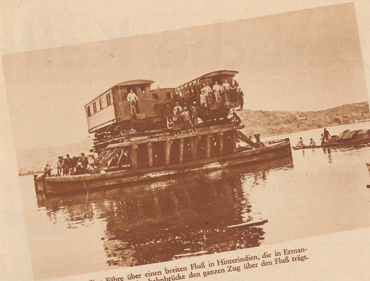
Eine Fähre über einen breiten Fluß in Hinterindien, die in Ermangelung einer Eisenbahnbrücke den ganzen Zug über den Fluß trägt.